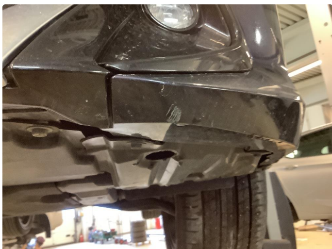
1.2 Skrubbskader underkant