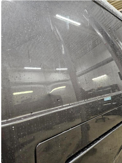
1.1 Bulk med lakkskade