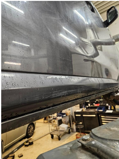
1.2 Bulk med lakkskade