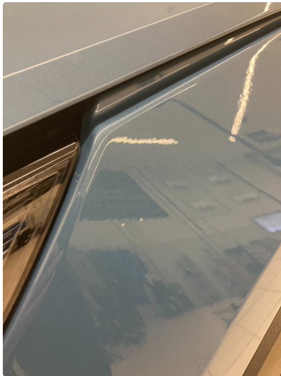
1.3 Steinsprut - flikkes