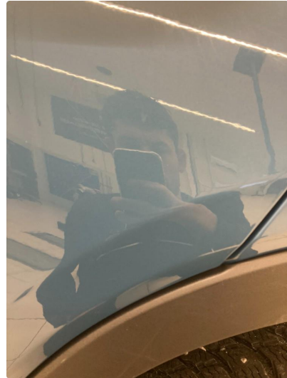
1.2 Riper - poleres