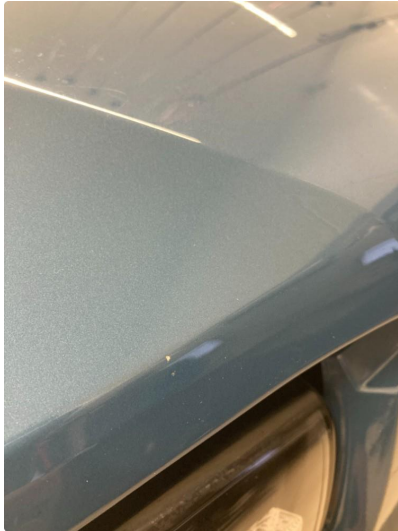
1.1 Steinsprut - flikkes