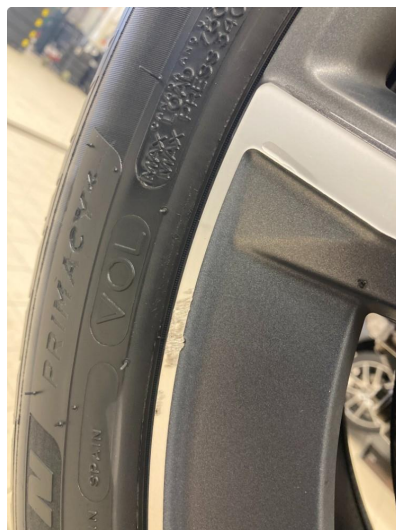
1.1 2 stk kantkjørt felger, høyre side