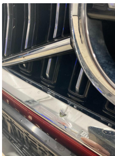
1.3 Steinsprut grill