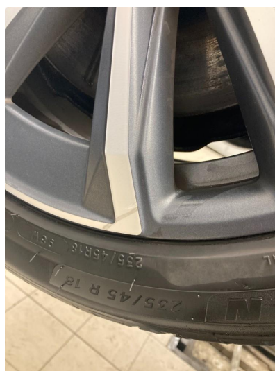
1.1 2 stk kantkjørt felger, høyre side