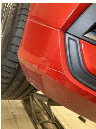
1.2 Riper i plast støtfanger foran - flikkes