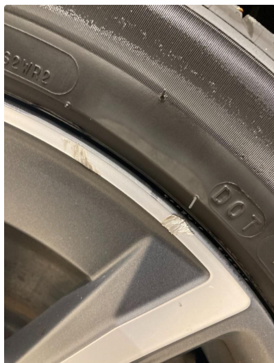
1.1 2 stk kantkjørt felger, høyre side