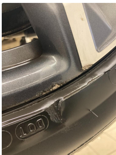
1.1 2 stk kantkjørt felger, høyre side