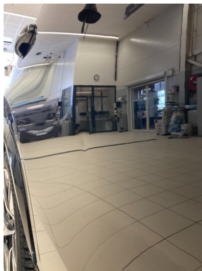
1.2 P-bulk. Vil bli reparert med smart repair.