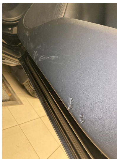
2.1 Skadet/merker etter utstyr