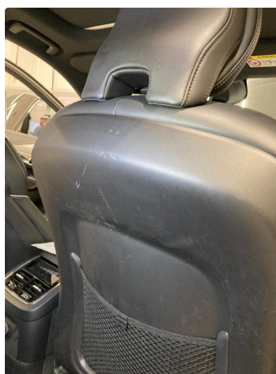
2.3 Skade på seterygg