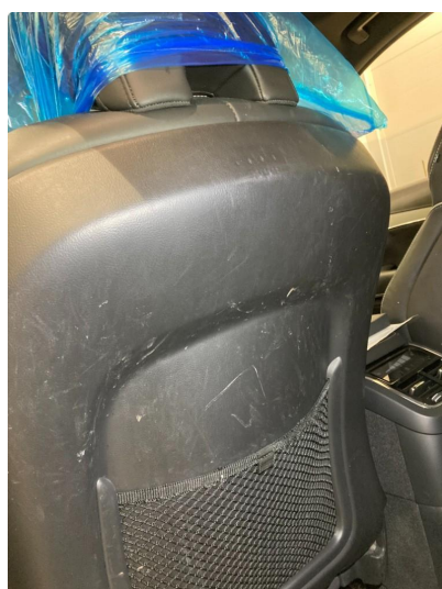
2.2 Skade på seterygg