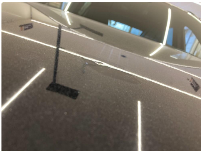
1.1 Bulk. Vil bli reparert med flikk.