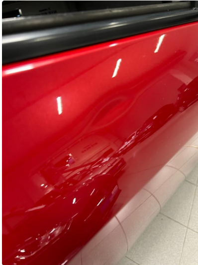
1.1 Bulk høyre bakdør