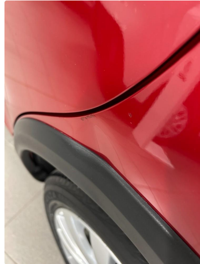
1.2 Bulk venstre bakskjerm