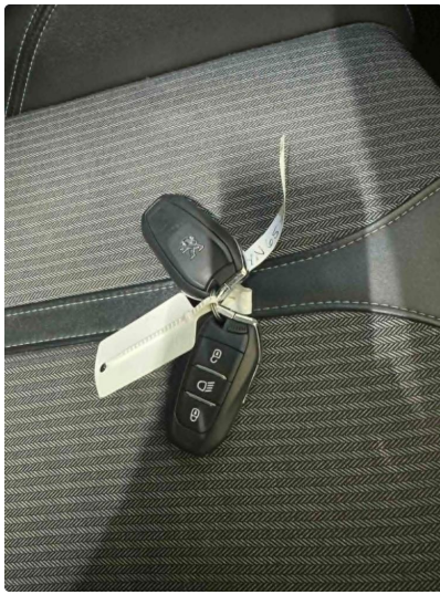
3.1 2 sett nøkler og servicehefte. Full historikk fra merkstedverksted.