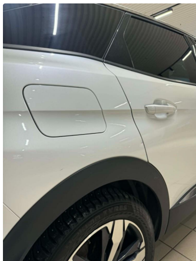
1.1 Normal slitasje i lakk iht alder og km Liten bulk