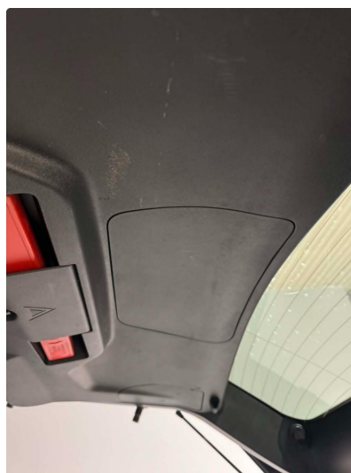
2.1 Normal bruksslitasje på bakluke