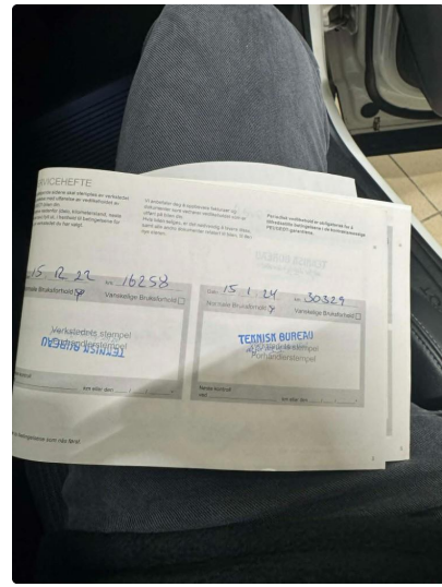
3.1 2 sett nøkler og servicehefte. Full historikk fra merkstedverksted.