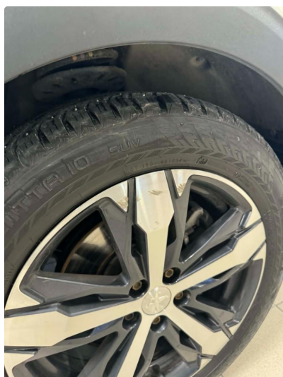
1.3 Lett slitasje på vinterfelg