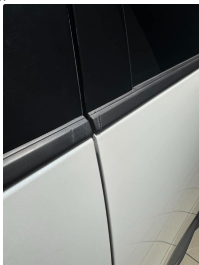
1.2 Slitasje på vinduslist