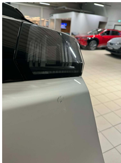
1.1 Normal slitasje i lakk iht alder og km Liten bulk