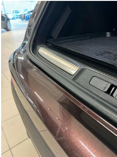
1.1 Lett slitasje i lakk. Normalt iht alder og km