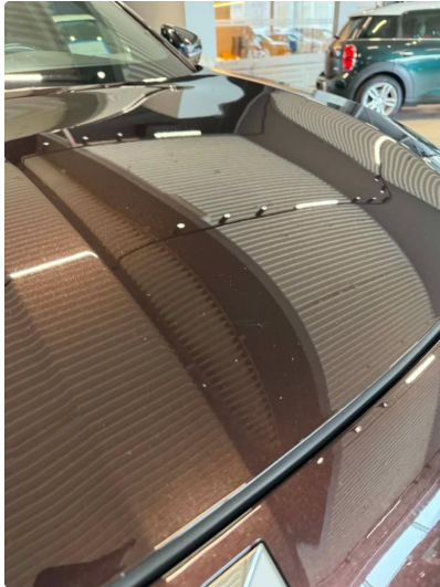
1.1 Lett slitasje i lakk. Normalt iht alder og km