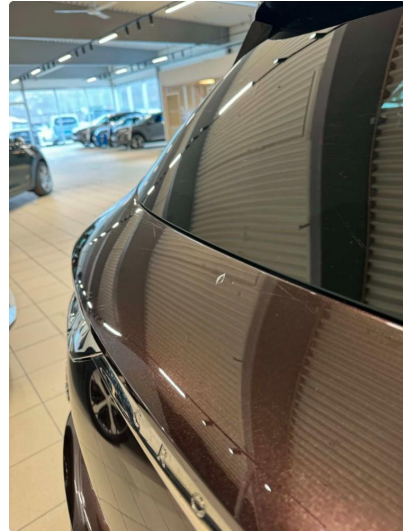
1.1 Lett slitasje i lakk. Normalt iht alder og km