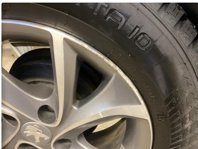
1.2 Noe oksidering