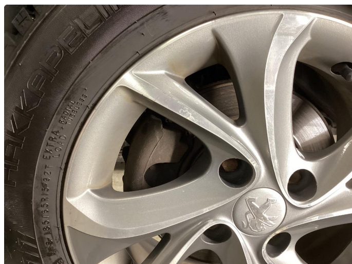
1.2 Noe oksidering