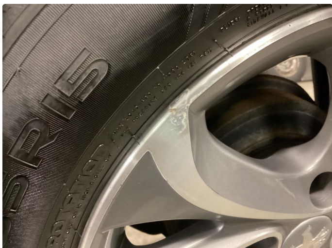
1.2 Noe oksidering