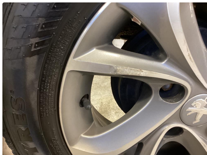
1.2 Noe oksidering