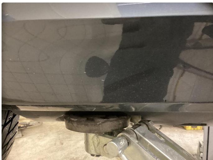
1.1 Normal bruksslitasje, steinsprut