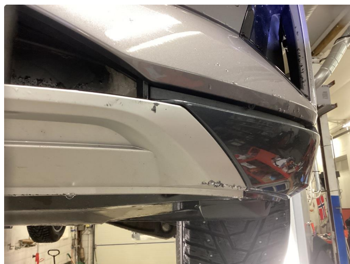
1.3 Mindre skrubbskader under forskjerm, normal bruksslitasje