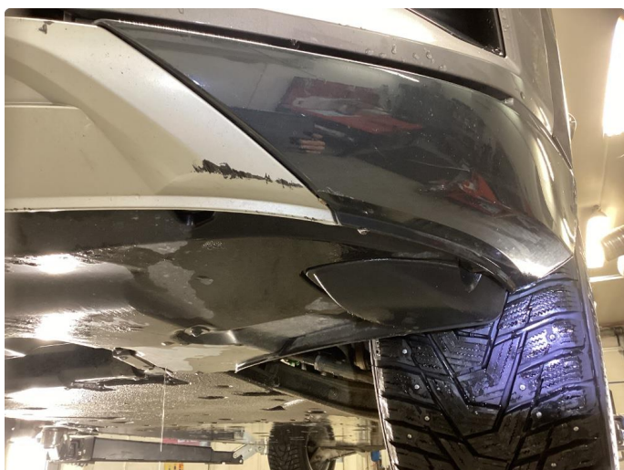
1.3 Mindre skrubbskader under forskjerm, normal bruksslitasje