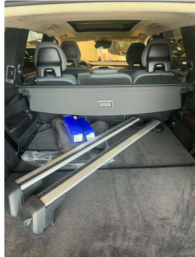
3.5 Skistativ & ubrukte stoffmatter