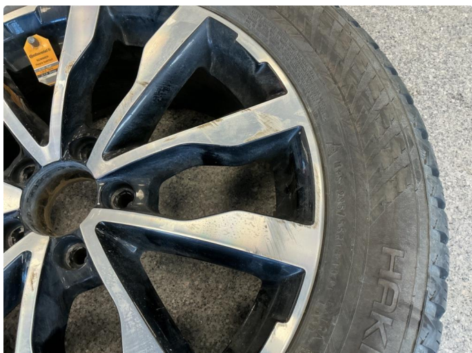
1.1 Normal slitasje på felg