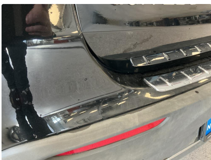
1.3 Normal slitasje i lakk iht alder og km