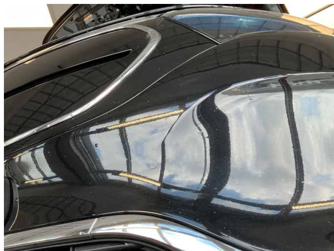
1.2 Noe steinsprut i frontfanger