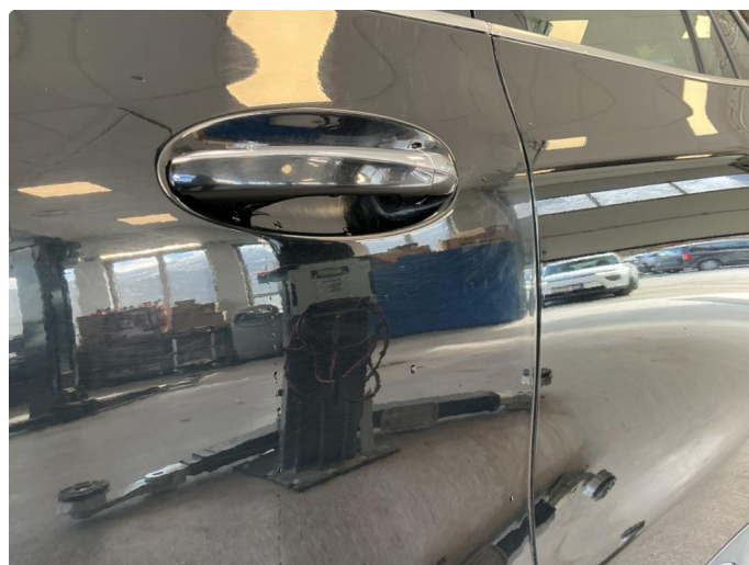
1.3 Normal slitasje i lakk iht alder og km