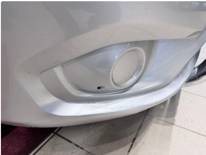
1.3 Mindre skade på støtfanger, reparert