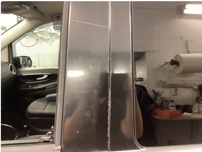
1.1 Noe bruksslitasje