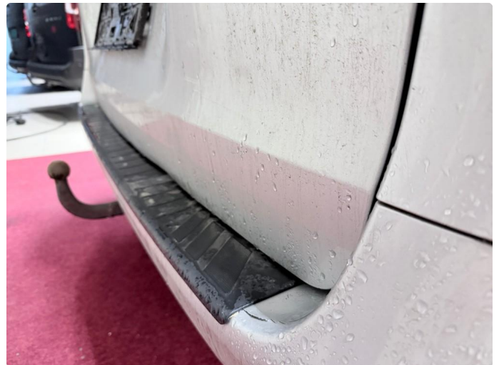
1.4 Mindre sprekk/skade i fanger bak