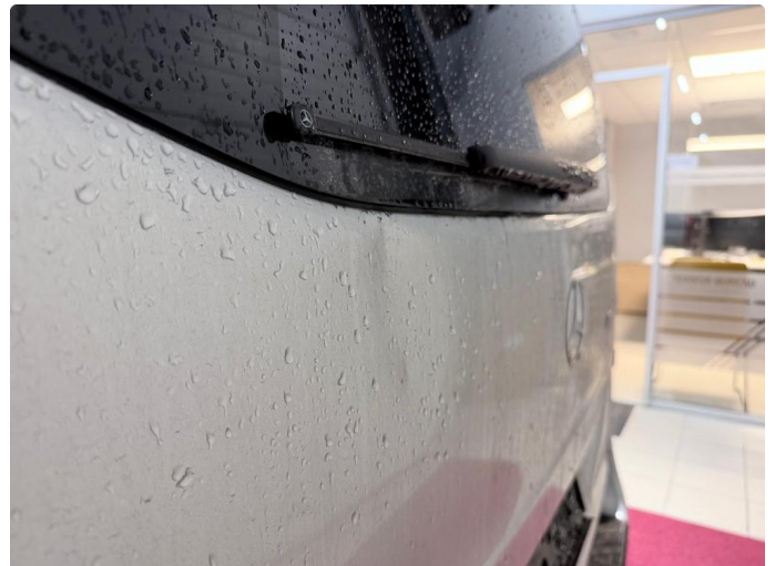
1.2 Liten bulk i luke til varerom