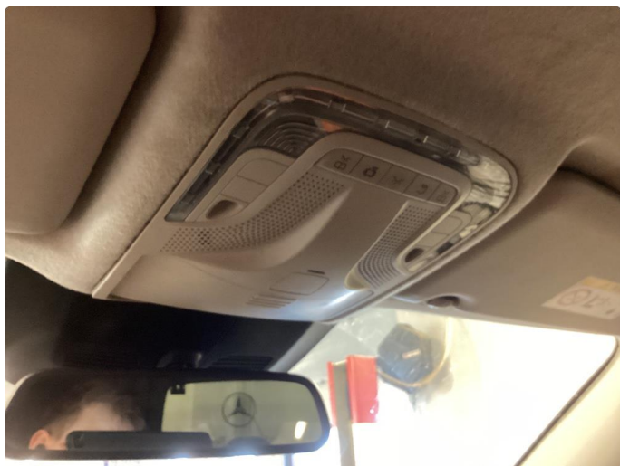
3.1 Kupebelysning lyser ikke