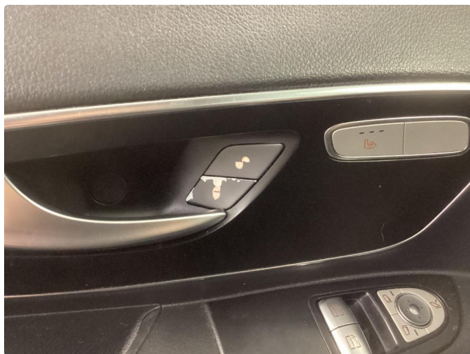
3.2 Noe bruksslitasje på bryter