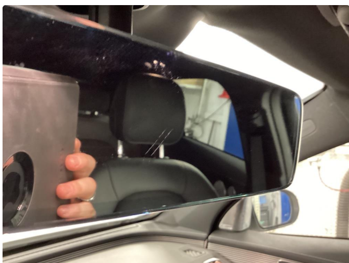
2.1 Ripe i innvendig speil