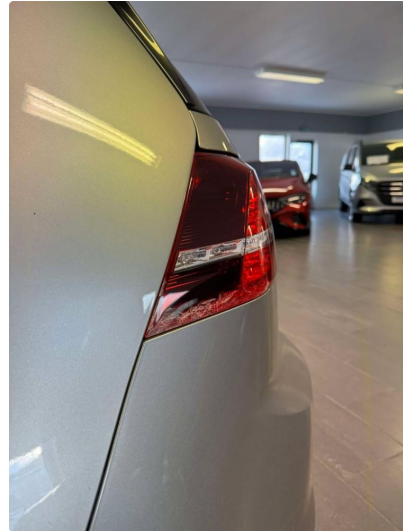
1.2 Noe sprekk i begge baklykter. Lykter tett, påvirker ikke lyktene. Kjen WAG situasjon