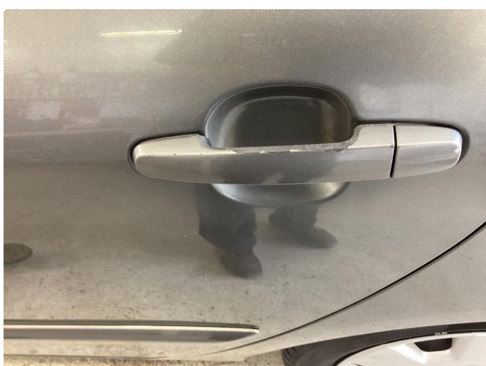
1.2 Håndtak lakkskadet/flasser