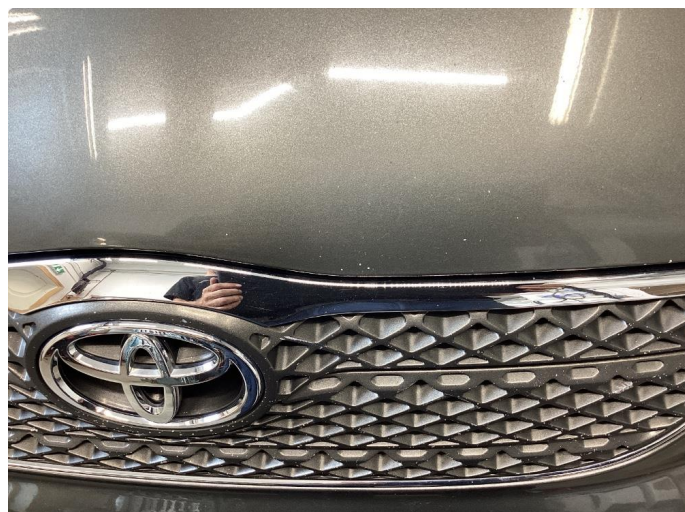
1.1 Steinsprut i panser