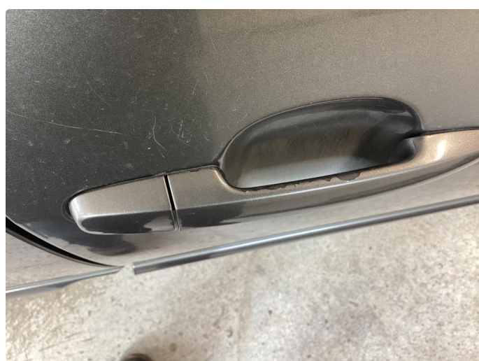
1.2 Håndtak lakkskadet/flasser