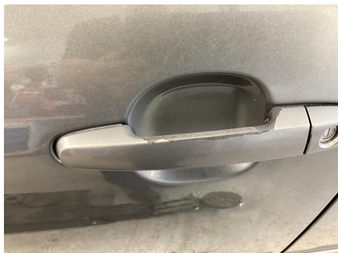
1.2 Håndtak lakkskadet/flasser