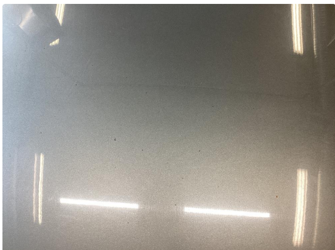
1.1 Steinsprut i panser