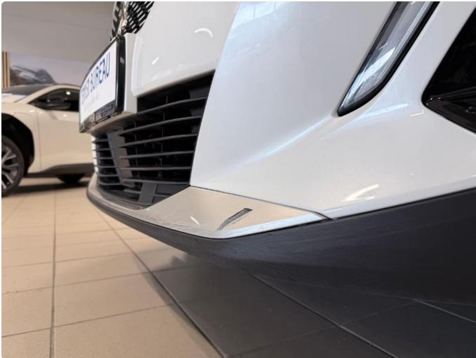
1.1 Mindre skade i fanger foran.