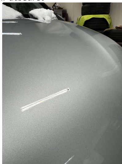
1.1 Bruksslitasje i lakk - Bulker blir utbedret