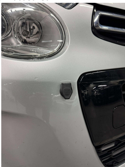
2.1 DEFA coupevarmer