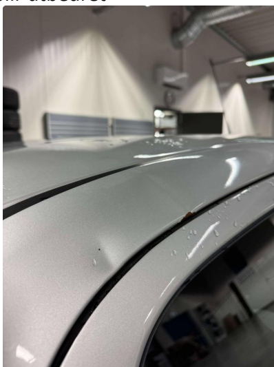
1.1 Bruksslitasje i lakk - Bulker blir utbedret