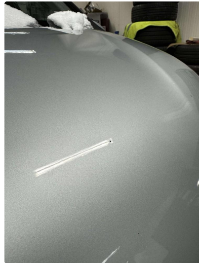
1.1 Bruksslitasje i lakk