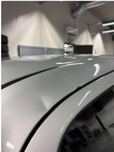
1.1 Bruksslitasje i lakk