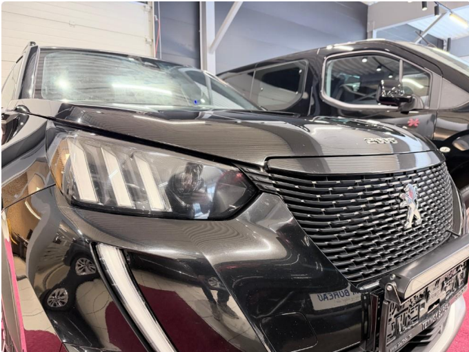
1.1 Noe stensprang