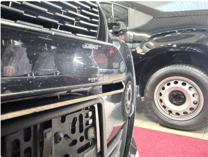
2.1 Lazer Linear 18 Elite