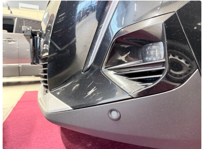
1.2 Lite merke i støtfanger venstre side