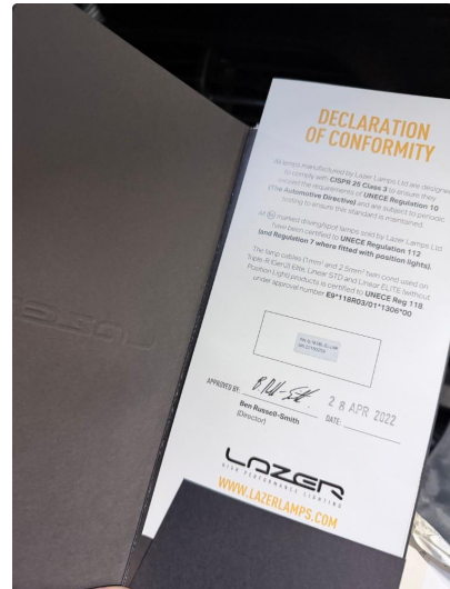
2.1 Lazer Linear 18 Elite