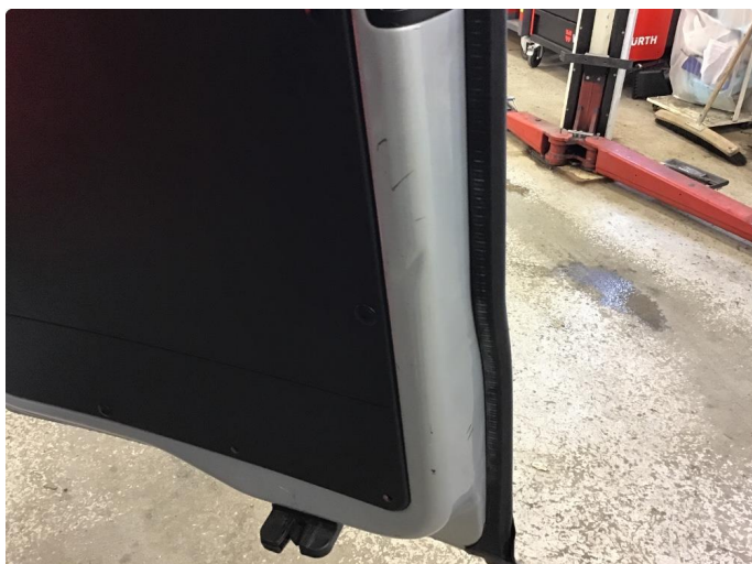
1.1 Noen riper