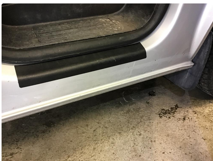
1.2 Noe riper - Normal bruksslitasje iht alder og km