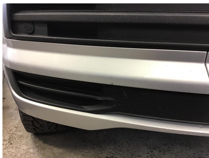
1.3 Noe steinsprut