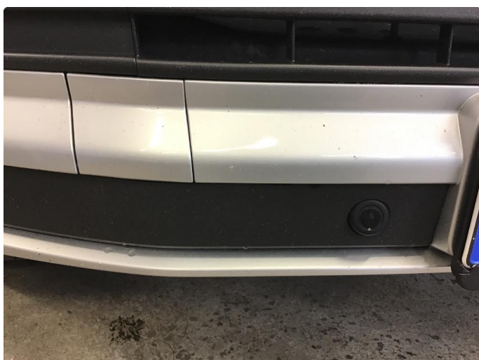
1.3 Noe steinsprut