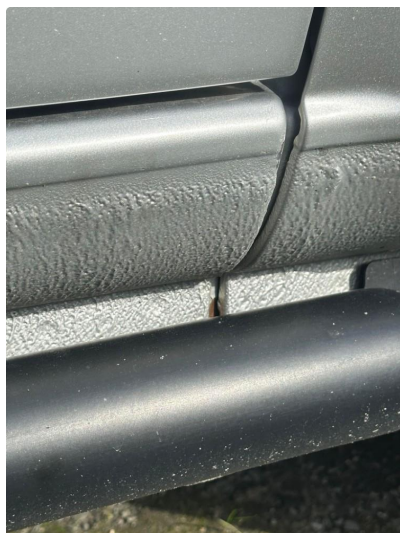
1.1 Forurensning av lakk i kanal