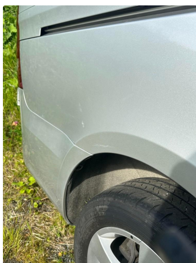
1.3 Mindre riper v & h.skjerm bak