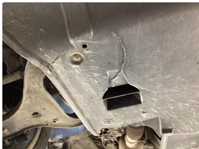
1.2 Beskyttelsesplate skadet/mangler