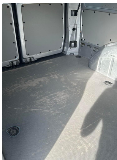
2.1 Normal brukssitasje i varerom