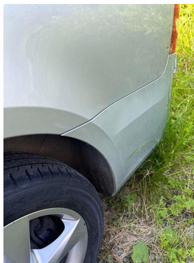
1.3 Mindre riper v & h.skjerm bak