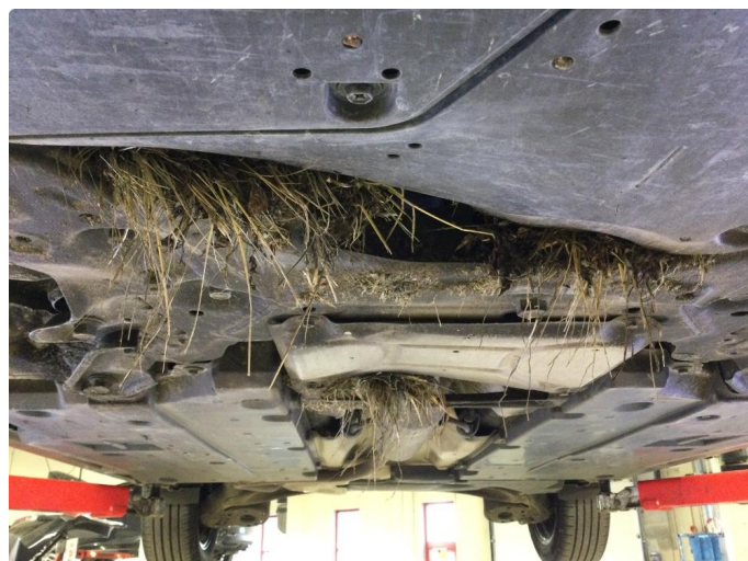
1.2 Noe riper underkant fram fanger