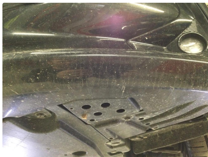
1.2 Noe riper underkant fram fanger