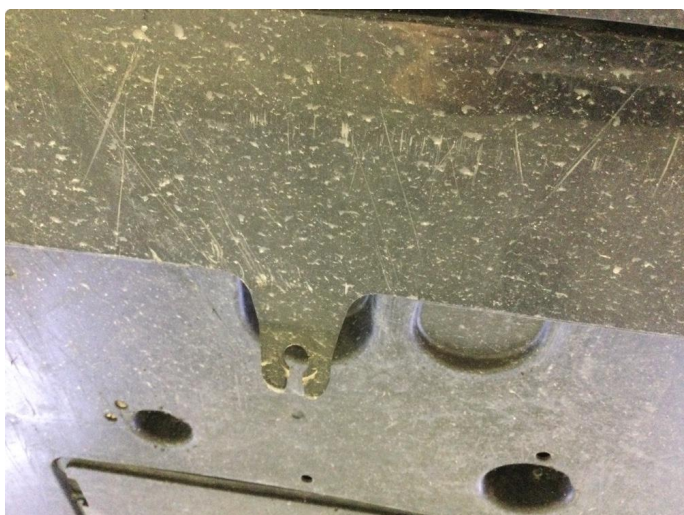
1.2 Noe riper underkant fram fanger