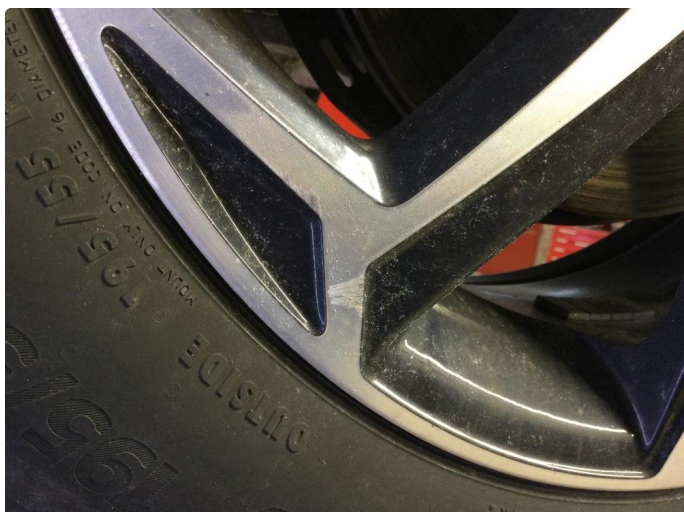
1.1 Noe striper H.F felg sommer