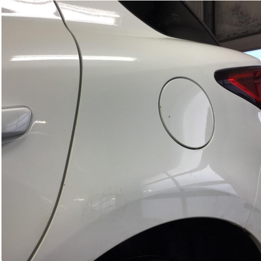
1.1 Noe steinsprut