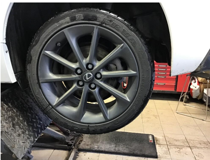
1.2 Noe kantkjørt felg