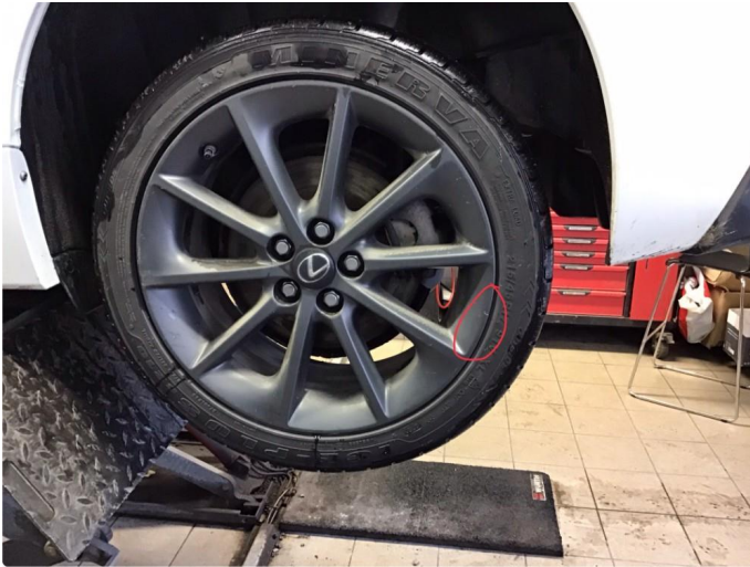
1.2 Noe kantkjørt felg