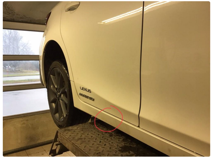
1.4 Liten ripe