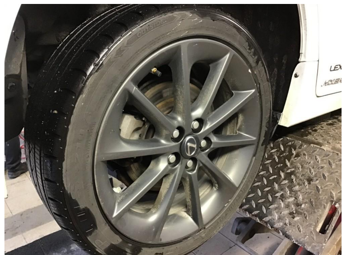
1.2 Noe kantkjørt felg