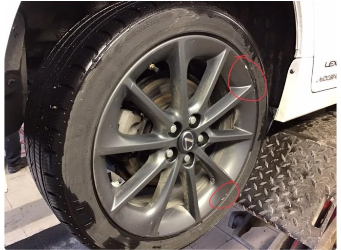
1.2 Noe kantkjørt felg