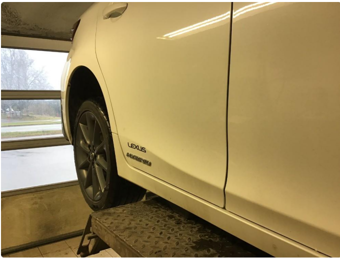
1.4 Liten ripe