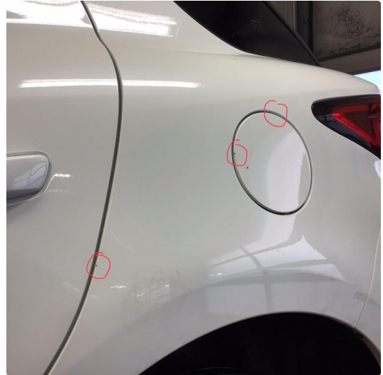
1.1 Noe steinsprut