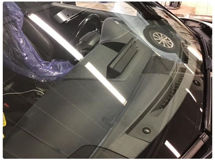
1.3 Noen sår i frontrute