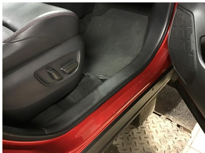
1.2 Noe småbulker finnes