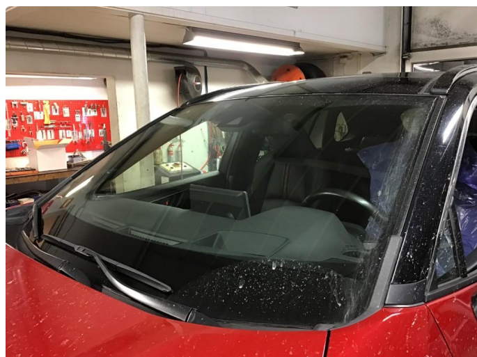
1.3 Lappet div steinsprett