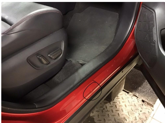
1.2 Noe småbulker finnes