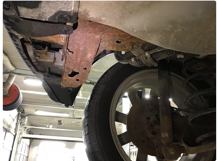
1.2 Noe rust under bil