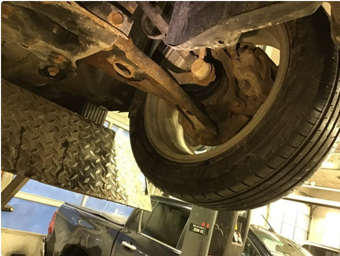
1.2 Noe rust under bil