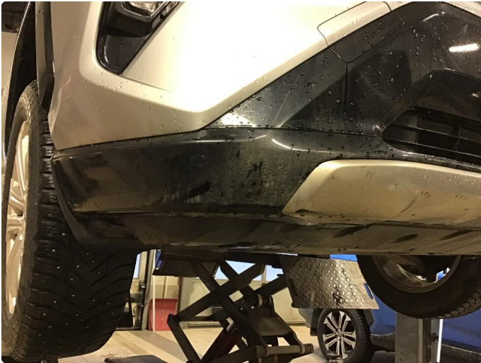
1.2 Skrubbskader underkant