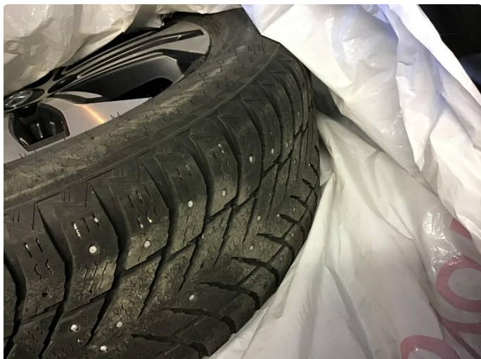
1.2 2m stk nye pigg dekk