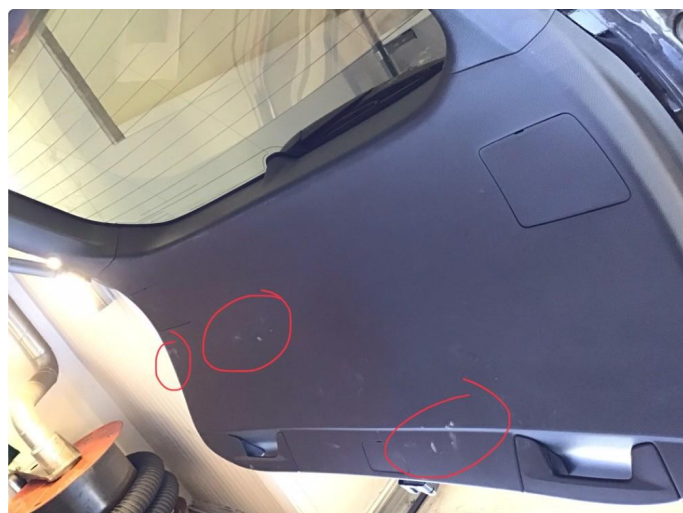
2.1 Div merker / Riper deksel bakluke innvendig