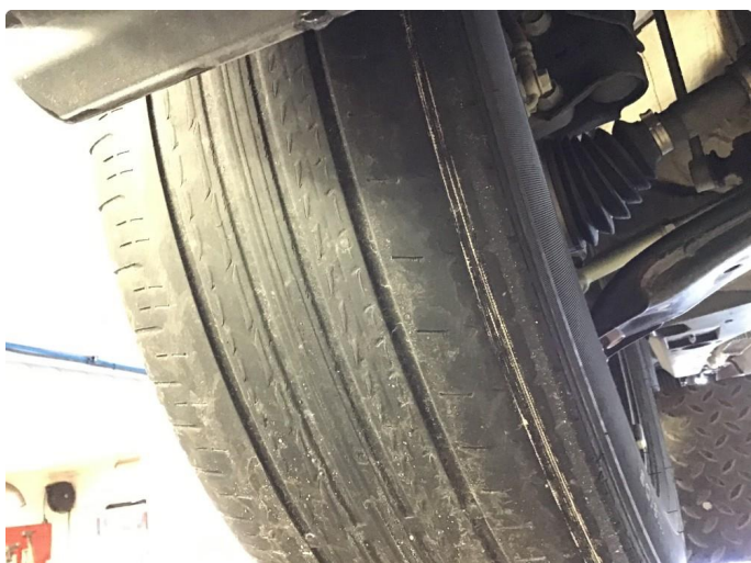
1.3 Nye sommer dekk