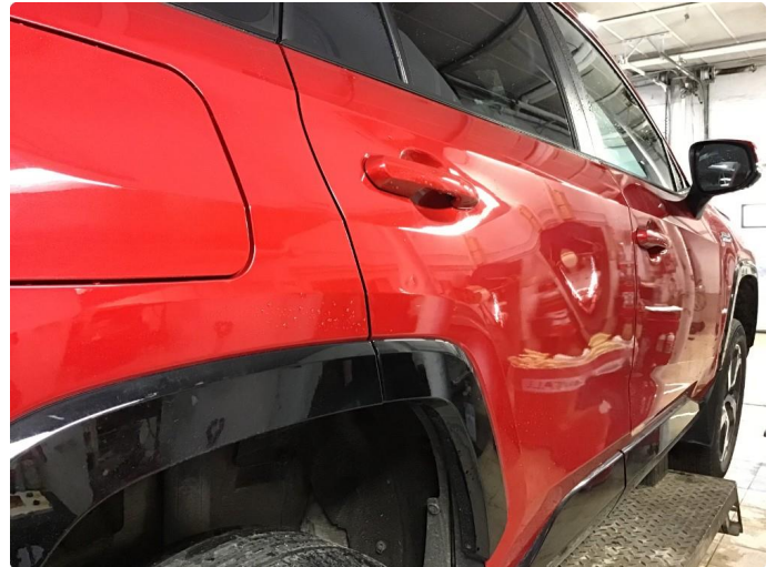
1.1 Liten p-bulk