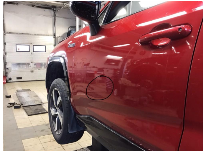
1.2 Liten p-bulk