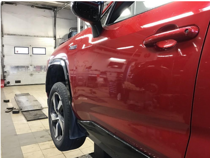
1.2 Liten p-bulk