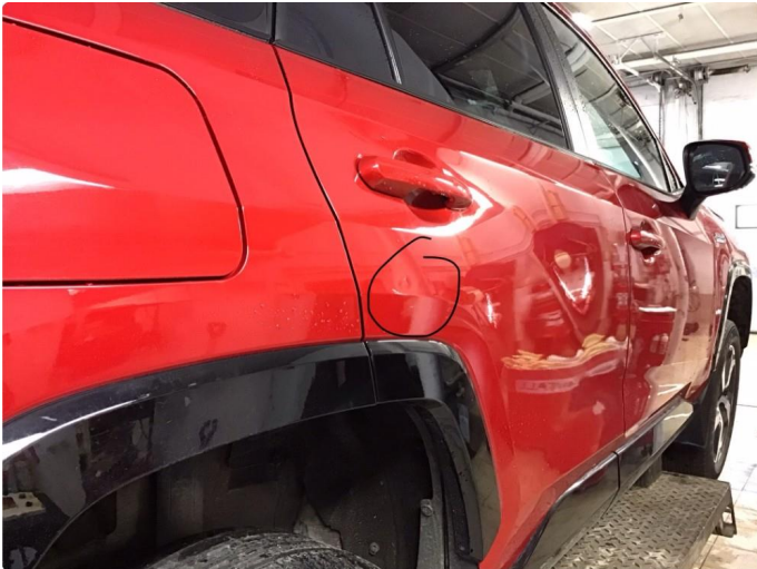
1.1 Liten p-bulk