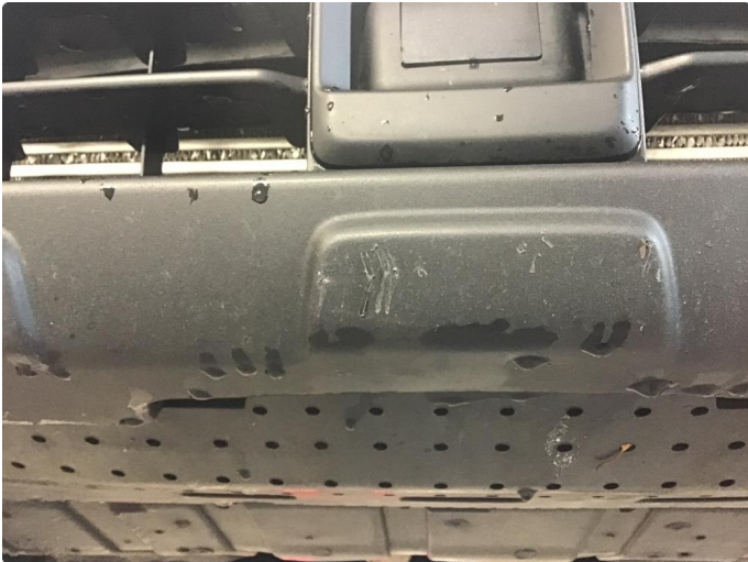
1.1 Skrapemerke i plast under støtfanger