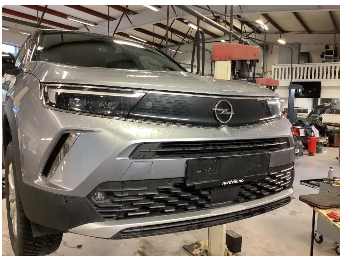
1.2 Generell bruksslitasje, dette er normalt i henhold til bilens alder og kilometerstand