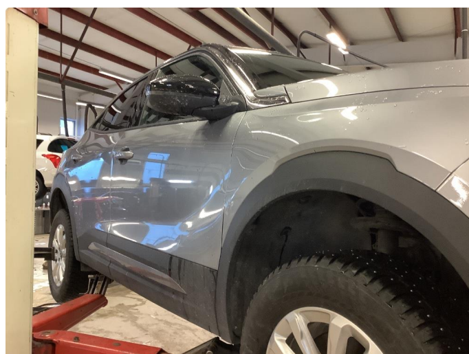
1.2 Generell bruksslitasje, dette er normalt i henhold til bilens alder og kilometerstand