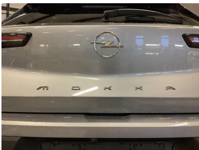
1.2 Generell bruksslitasje, dette er normalt i henhold til bilens alder og kilometerstand