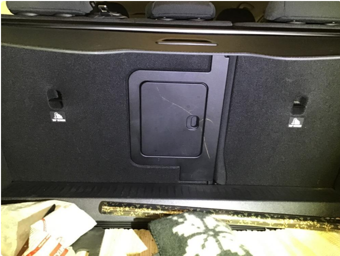
1.1 Merke på skiluke