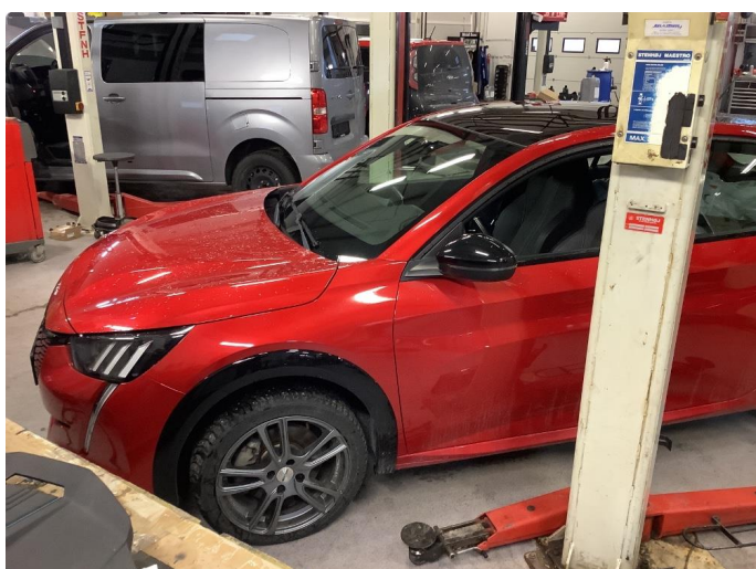
1.1 Generell bruksslitasje, dette er normalt i henhold til bilens alder og kilometerstand