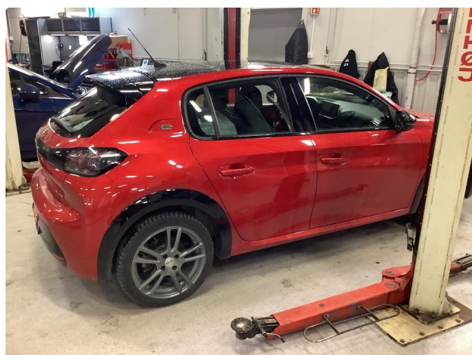
1.1 Generell bruksslitasje, dette er normalt i henhold til bilens alder og kilometerstand