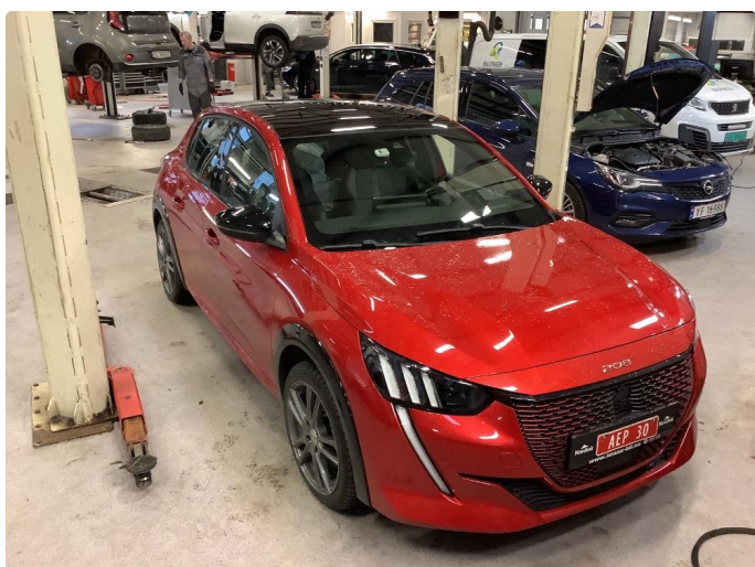
1.1 Generell bruksslitasje, dette er normalt i henhold til bilens alder og kilometerstand