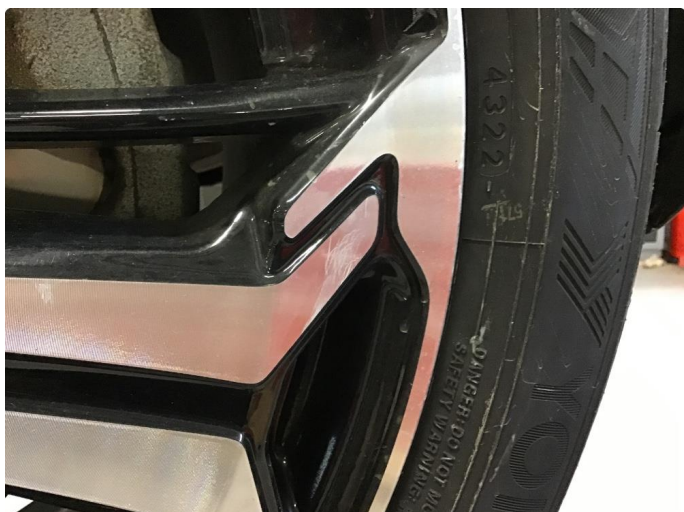
1.1 Ripe på felg