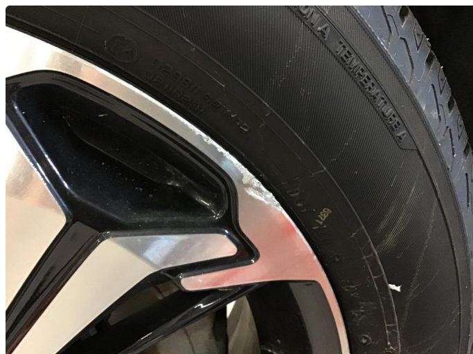
1.1 Ripe på felg