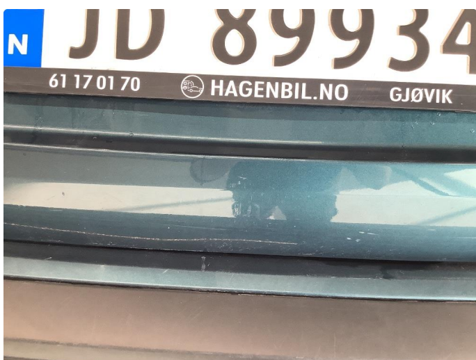
1.4 Sår/riper rundt om på bilen.