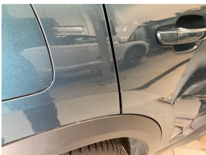
1.2 Sår/riper rundt om på bilen.