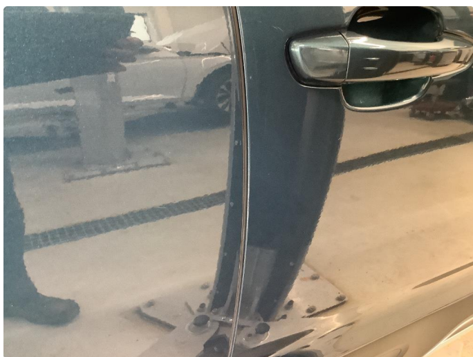
1.2 Sår/riper rundt om på bilen.