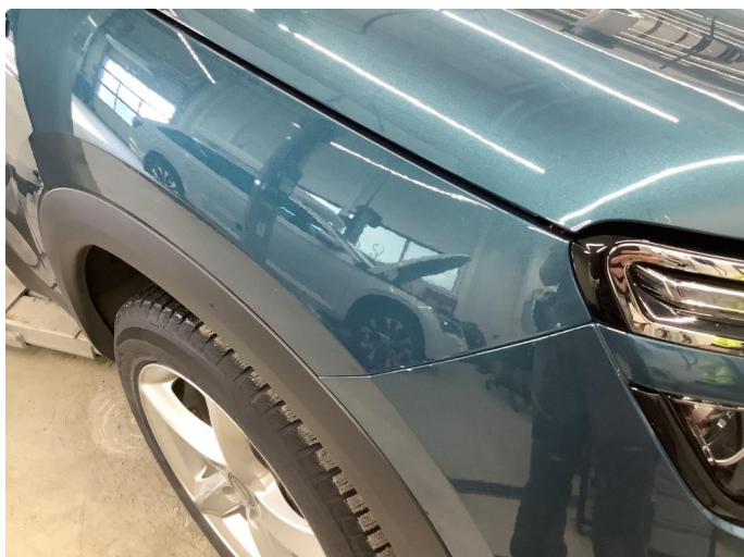
1.1 Sår/riper rundt om på bilen.