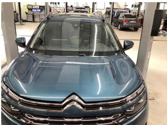
1.1 Sår/riper rundt om på bilen.