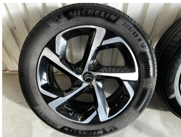
1.8 En kantkjørt sommerfelg