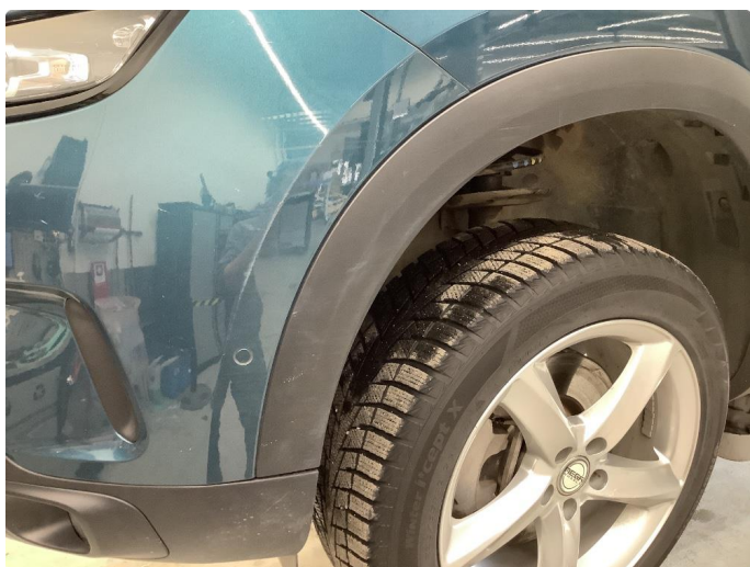
1.6 Sår/riper rundt om på bilen.