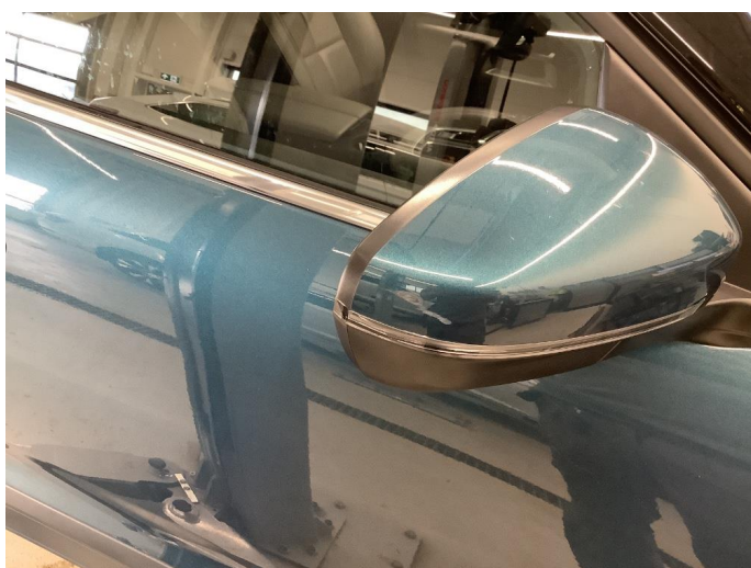
1.7 Sår/riper rundt om på bilen.