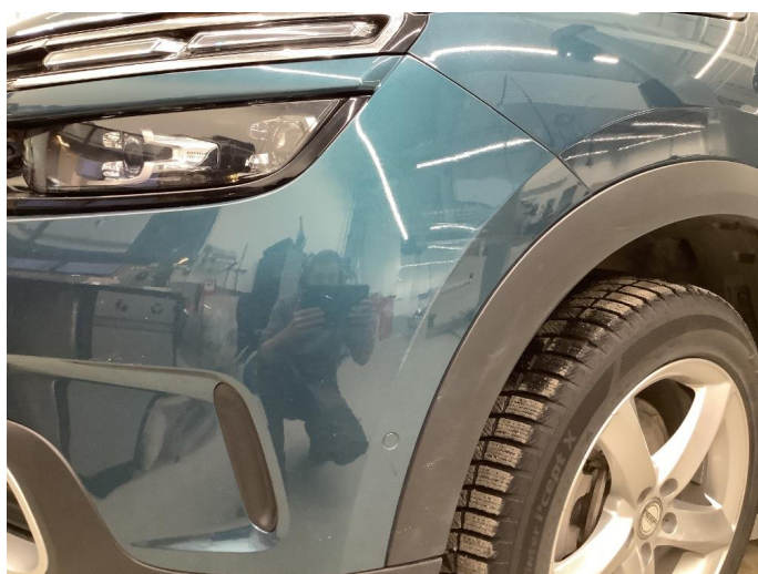
1.9 Sår/riper rundt om på bilen.