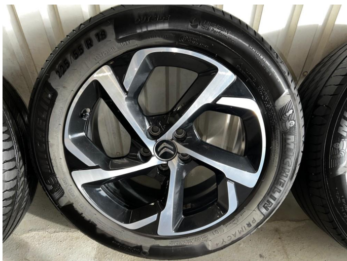
1.8 En kantkjørt sommerfelg