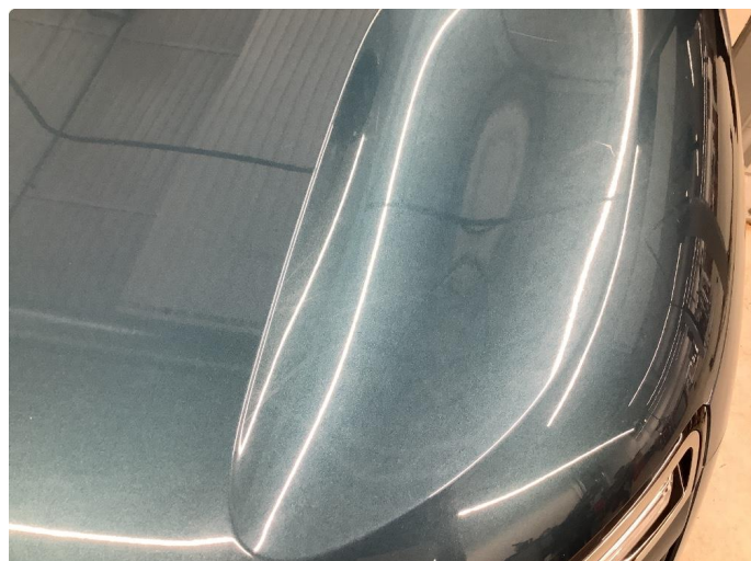
1.1 Sår/riper rundt om på bilen.