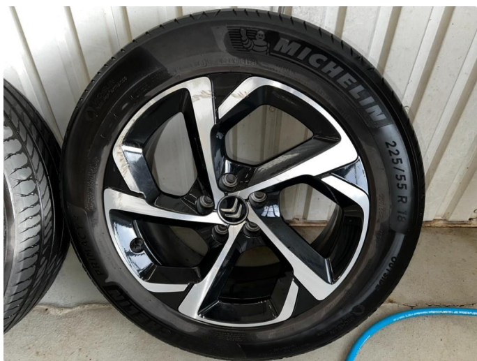
1.8 En kantkjørt sommerfelg