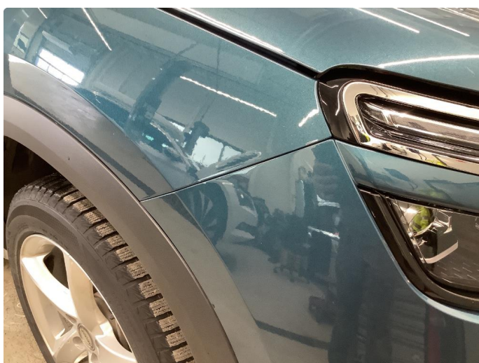
1.9 Sår/riper rundt om på bilen.