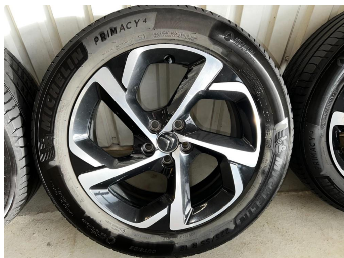
1.8 En kantkjørt sommerfelg