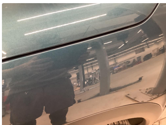
1.5 Sår/riper rundt om på bilen.