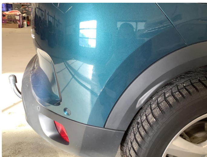
1.9 Sår/riper rundt om på bilen.