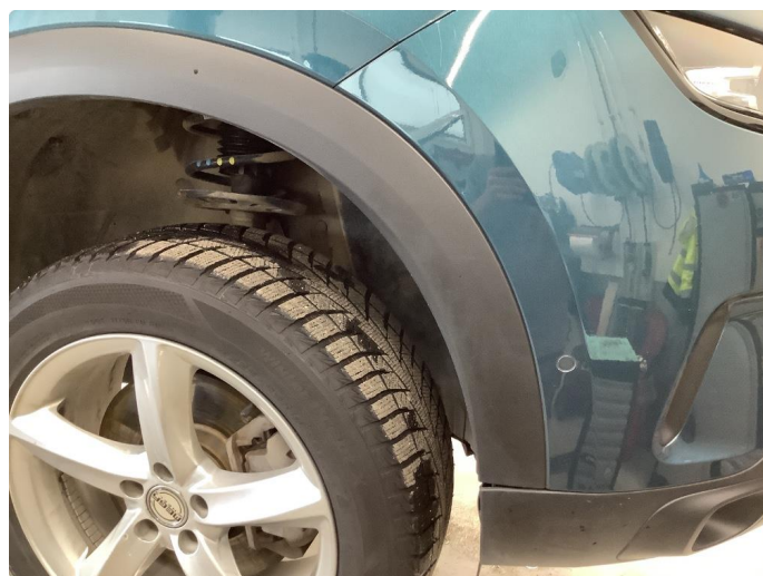
1.6 Sår/riper rundt om på bilen.