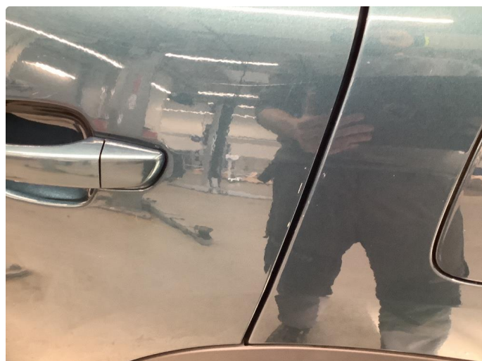
1.2 Sår/riper rundt om på bilen.