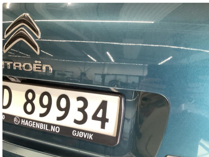
1.3 Bulk med lakkskade