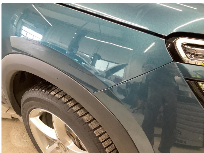
1.5 Sår/riper rundt om på bilen.