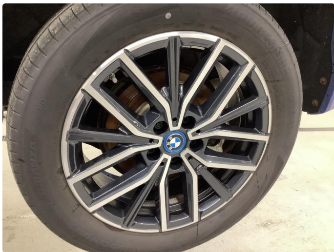
1.5 Ripe (r) gjennom lakk