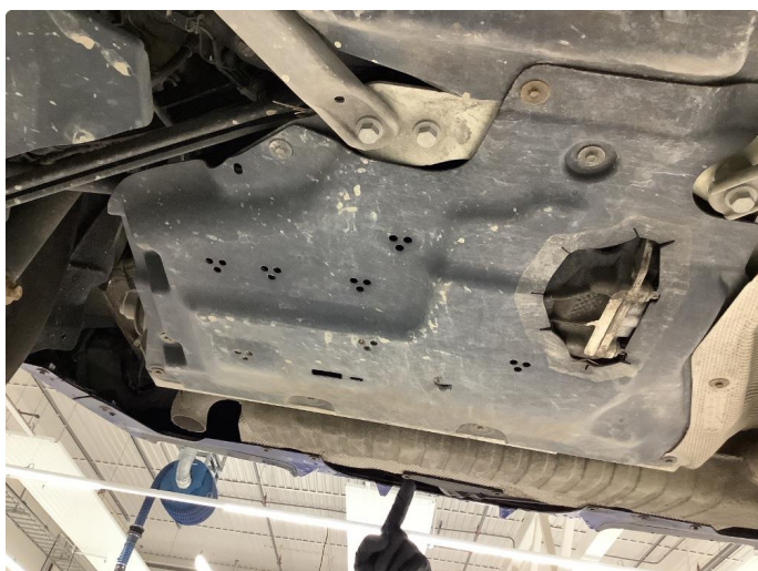
1.2 Beskyttelsesplate skadet/mangler