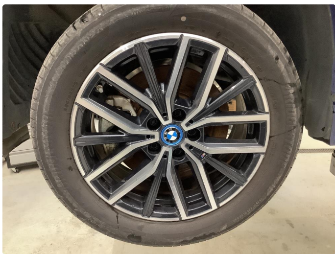
1.5 Ripe (r) gjennom lakk