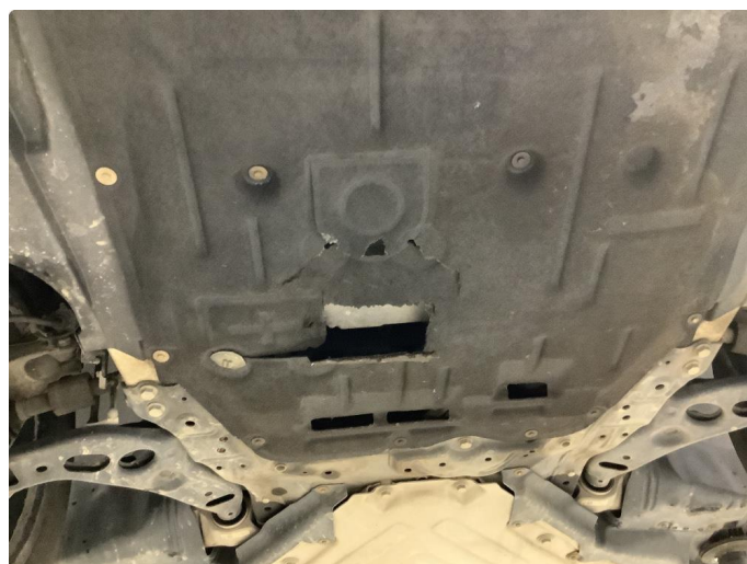
1.3 Beskyttelsesplate skadet/mangler