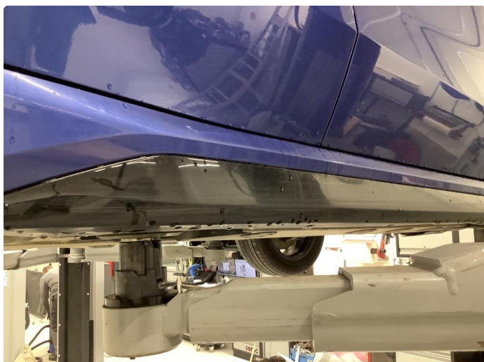
1.1 Generelt mye bruksslitasje