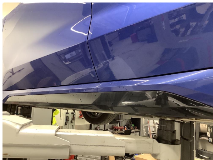
1.1 Generelt mye bruksslitasje