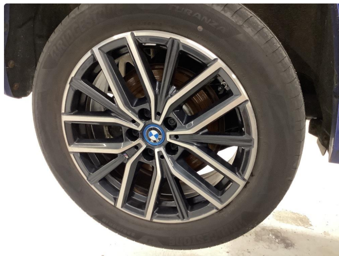
1.5 Ripe (r) gjennom lakk