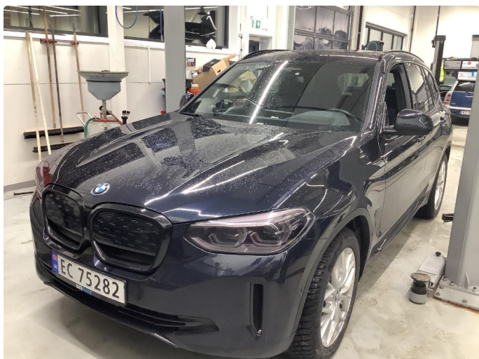
1.1 Vaskeriper og steinsprut / normalt for alder og km.