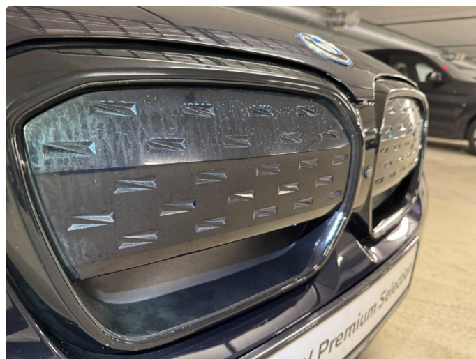
1.4 Vanmerker i plast