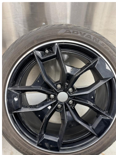
1.2 Skader/riper på sommerfelg