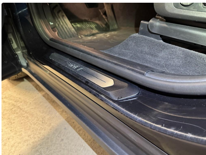
1.3 Riper i innsteg