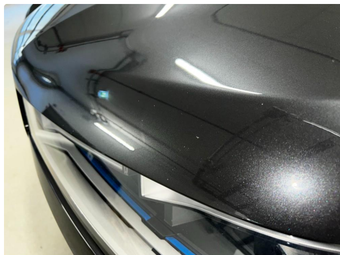
1.1 Sår/riper rundt om på bilen. Normalt for år/kilometer.