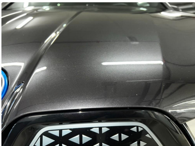
1.1 Sår/riper rundt om på bilen. Normalt for år/kilometer.