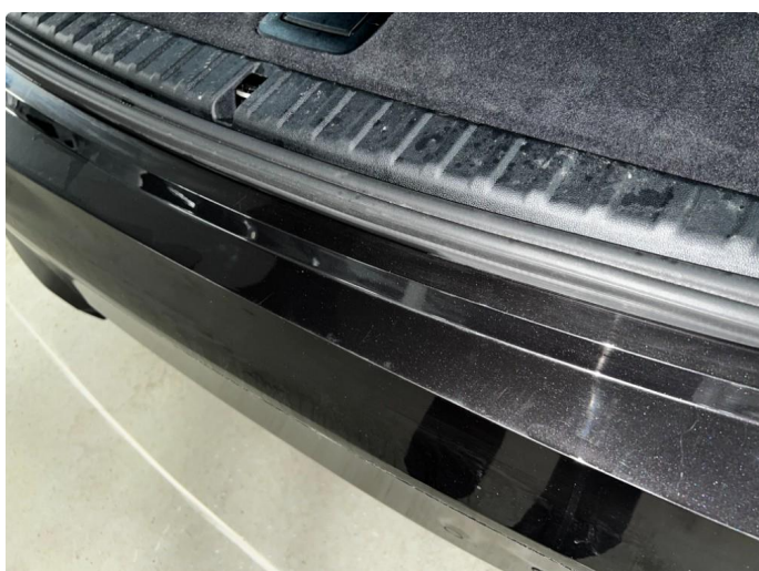
1.1 Sår/riper rundt om på bilen. Normalt for år/kilometer.