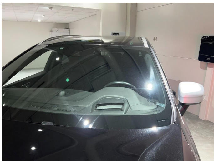
1.15 Noe stensprut/slitasje på frontruten.