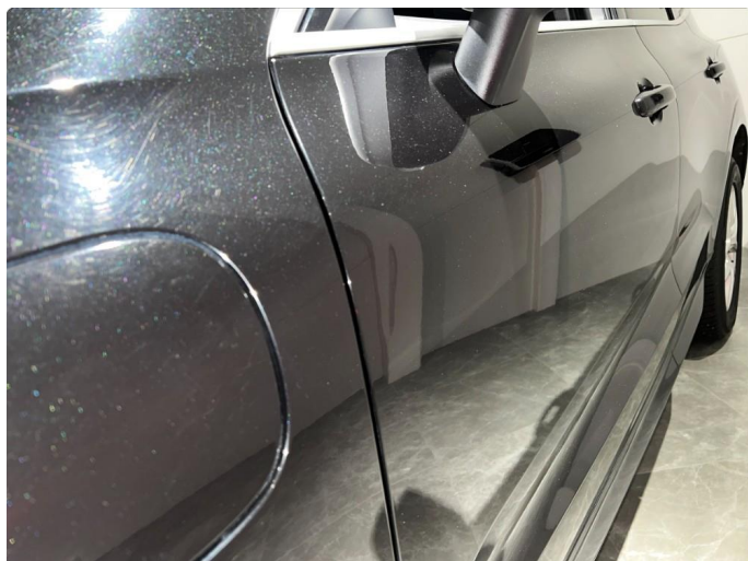
1.17 Sår/riper på ladeluke.