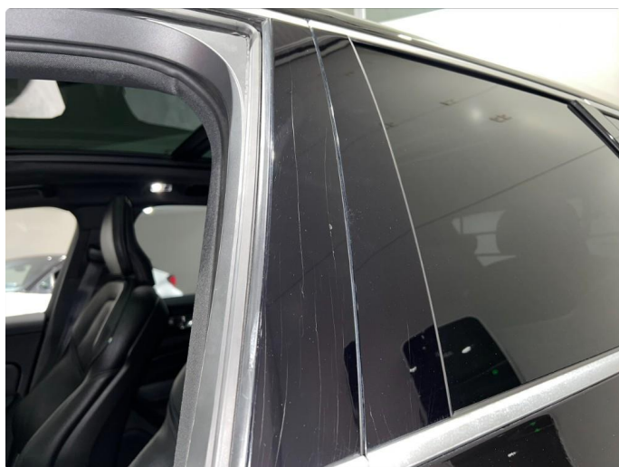
1.16 Krakelering/sprekker i pyntelister.