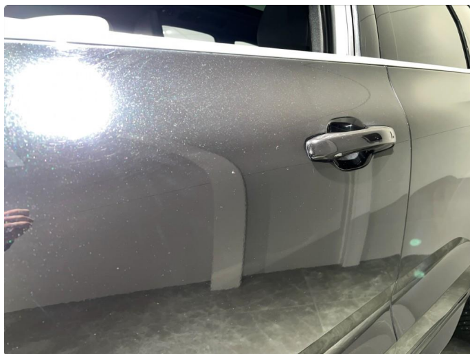
1.4 Sår/riper rundt om på dører. Normalt for år/km.