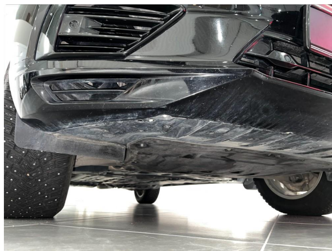
1.13 Ripper på underside.