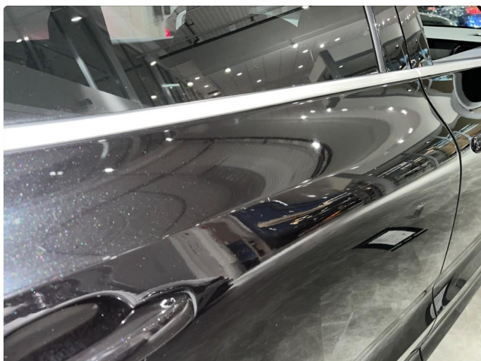
1.4 Sår/riper rundt om på dører. Normalt for år/km.