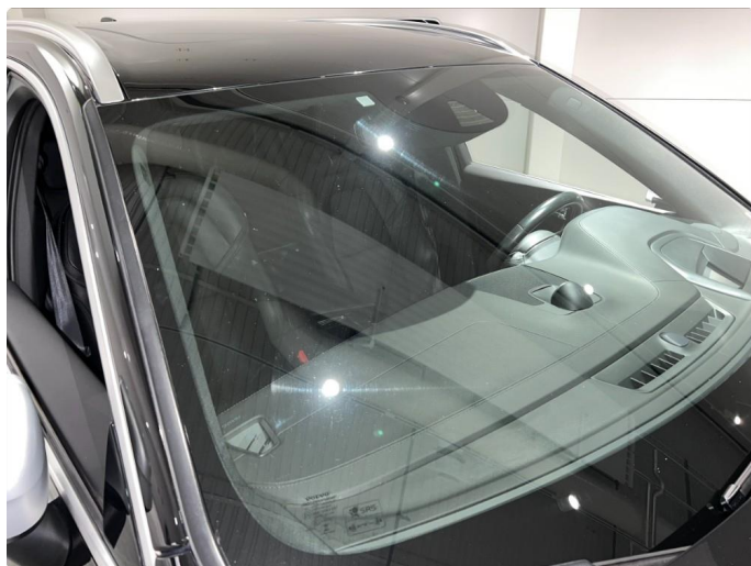
1.15 Noe stensprut/slitasje på frontruten.