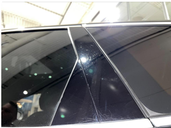
1.16 Krakelering/sprekker i pyntelister.