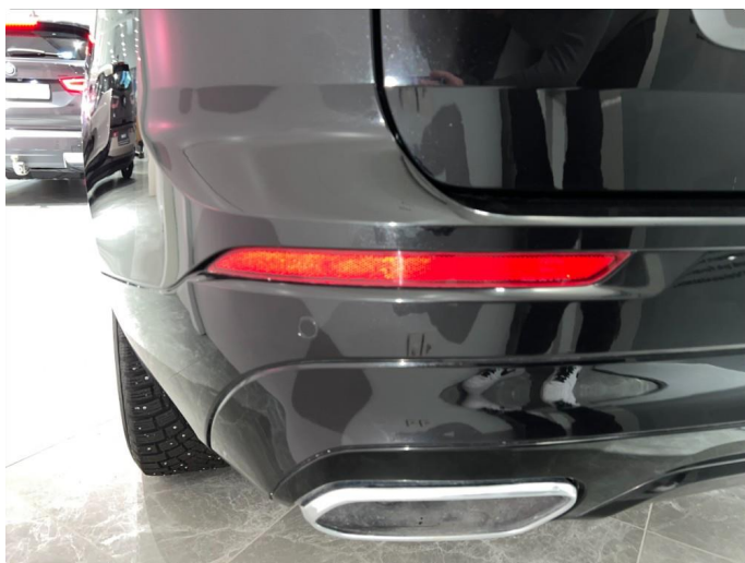
1.12 Sår/riper rundt om på støtfanger bak.