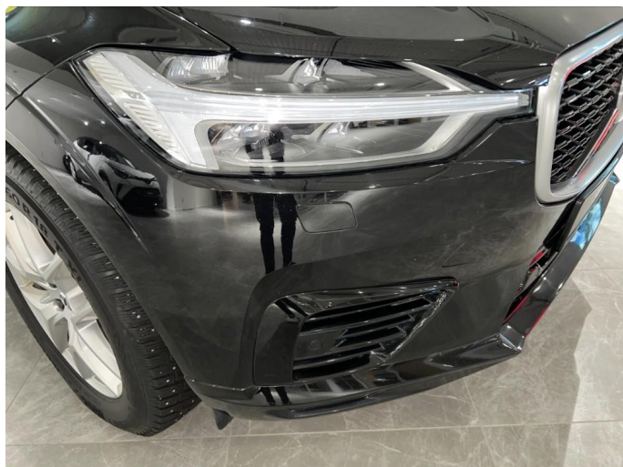
1.11 Noe stensprut/sår rundt om på støtfanger foran