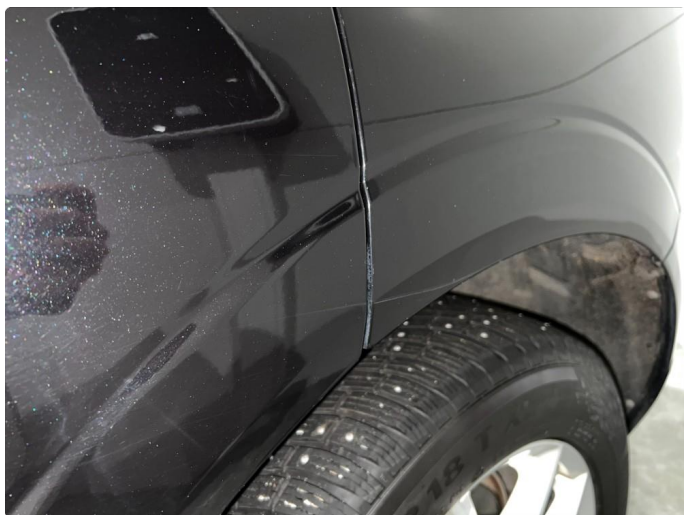
1.4 Sår/riper rundt om på dører. Normalt for år/km.