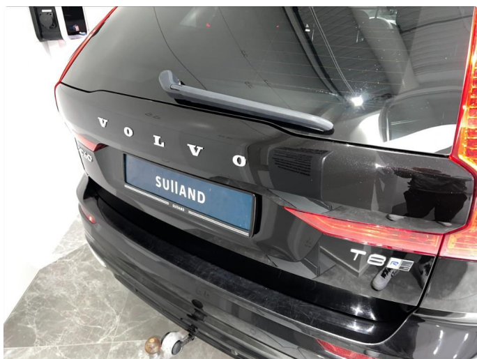
1.7 Bakluke delvis opp lakkert, ser ok ut.