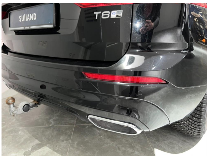
1.12 Sår/riper rundt om på støtfanger bak.