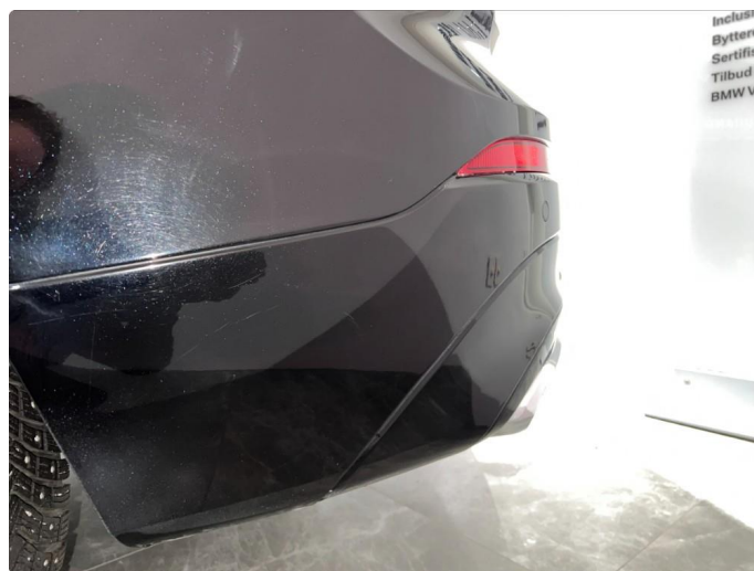
1.12 Sår/riper rundt om på støtfanger bak.