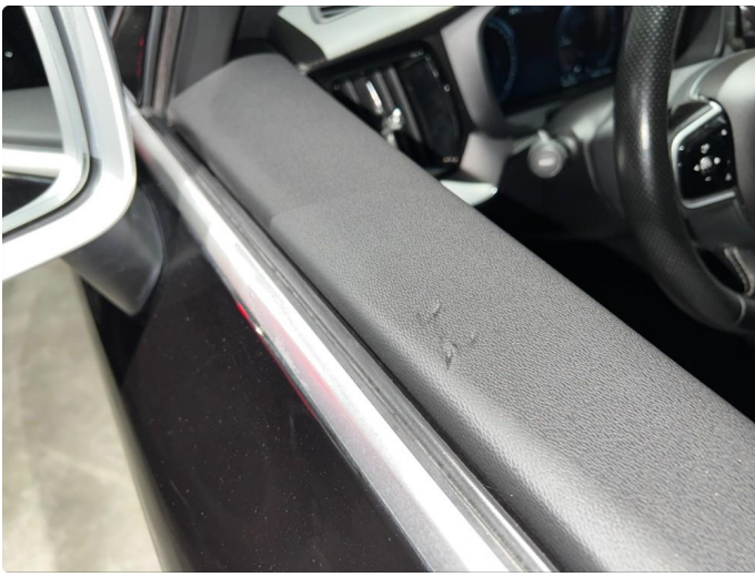
2.1 Hakk i dørtrekk.