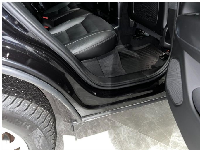
1.8 Sår/riper i dørterskler, normalt for år/km.