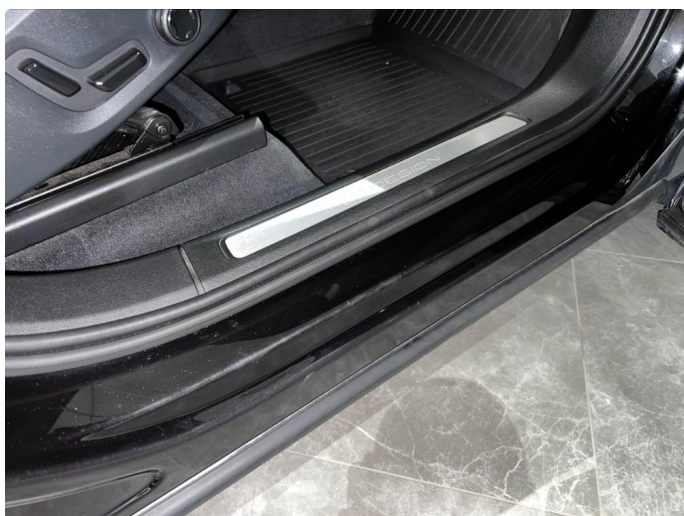
1.8 Sår/riper i dørterskler, normalt for år/km.