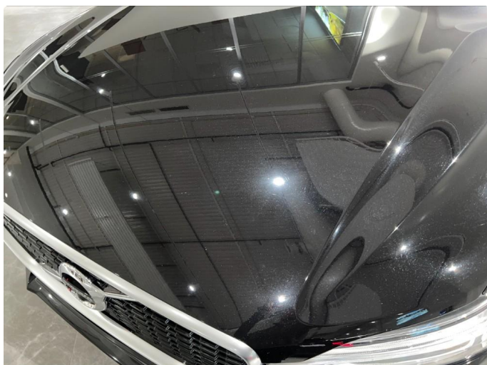
1.2 En del sår/riper rundt om på panser, det meste ser ut som vaske riper. Normalt for kilometer.