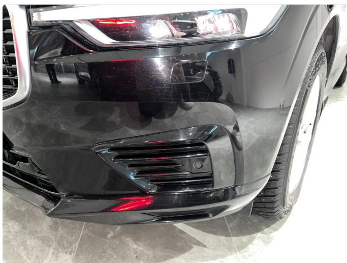
1.11 Noe stensprut/sår rundt om på støtfanger foran