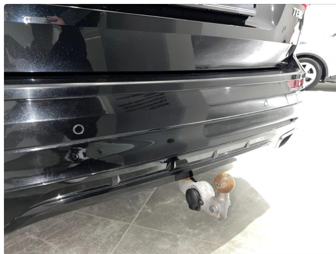
1.12 Sår/riper rundt om på støtfanger bak.