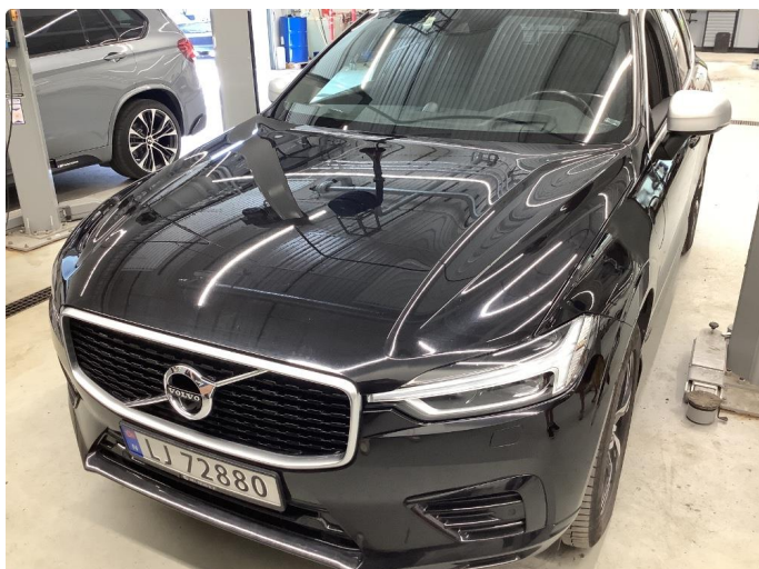
1.1 Sår/riper rundt om på bilen. Normalt for år/km.