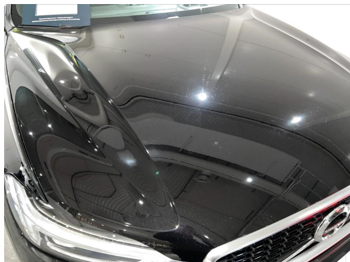
1.2 En del sår/riper rundt om på panser, det meste ser ut som vaske riper. Normalt for kilometer.