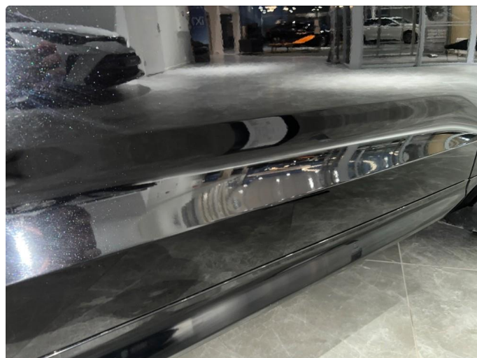
1.4 Sår/riper rundt om på dører. Normalt for år/km.