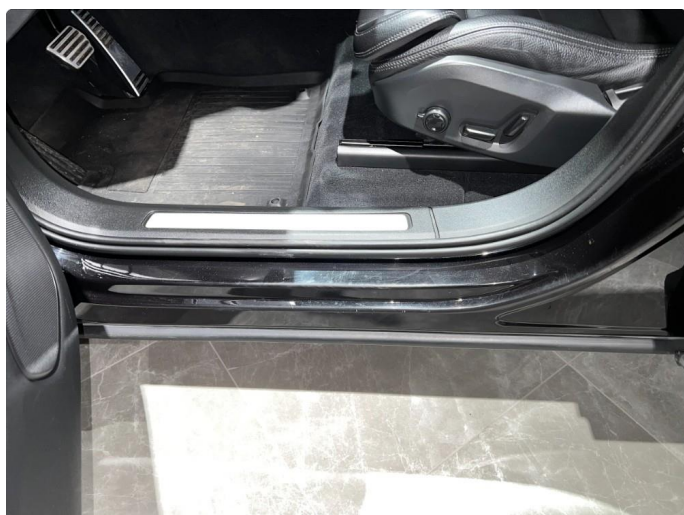
1.8 Sår/riper i dørsterskler, normalt for år/km.