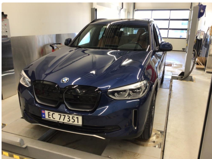
1.1 Vaske riper rundt om på bil, bedre en normalt for år/km.