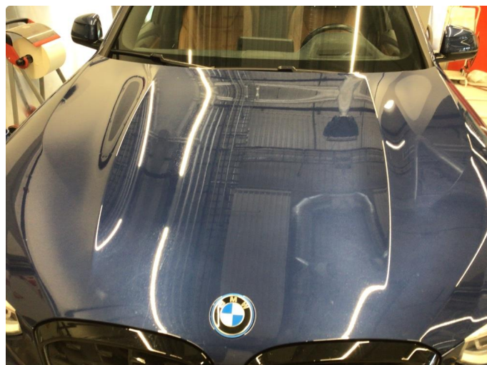
1.2 Noe mindre stensprut rundt om på panser, bedre en normalt for år/km.