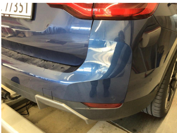
1.3 Mindre riper på støtfanger bak, bedre en normalt for år/km.