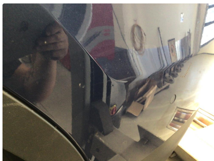
1.4 Sår/riper på støtfanger bak. Bedre en normalt for år/km.