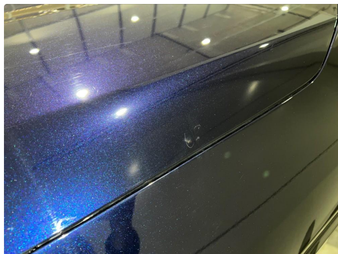
1.2 Noe mindre stensprang på panser og front fanger. Normalt for km.