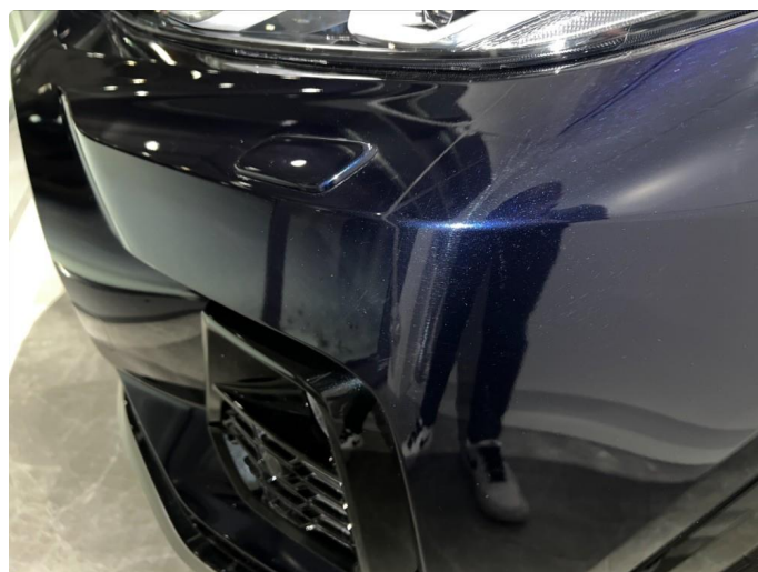
1.4 Noe sår/riper rundt om på front fanger. Normalt for år/km.