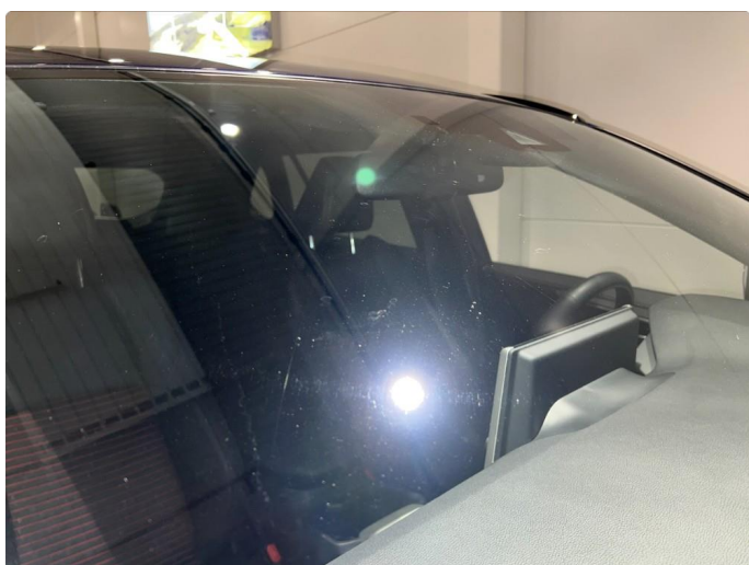
1.5 Noe mindre stensprang på frontrute.