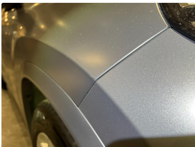
1.4 Mindre sår/riper. Normalt for kilometer.