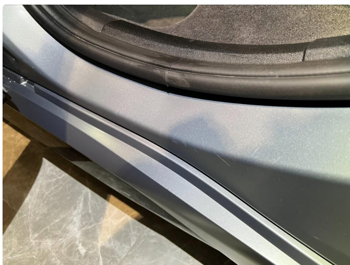
1.6 Noen sår/riper. Normalt for kilometer/år.