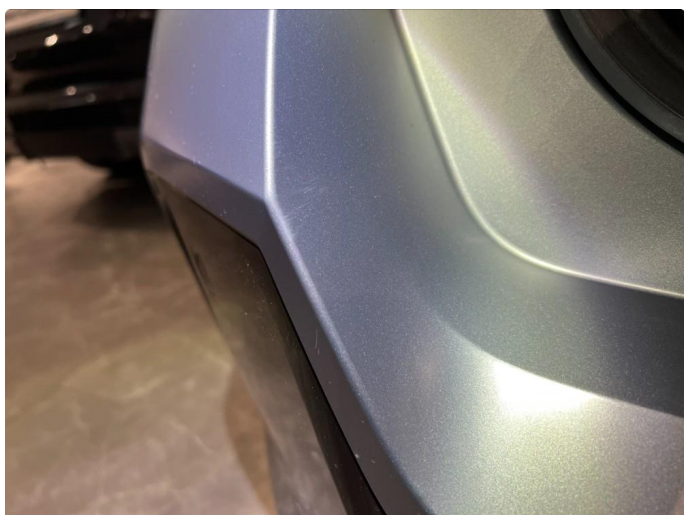
1.8 Noen sår/riper. Normalt for år/km.