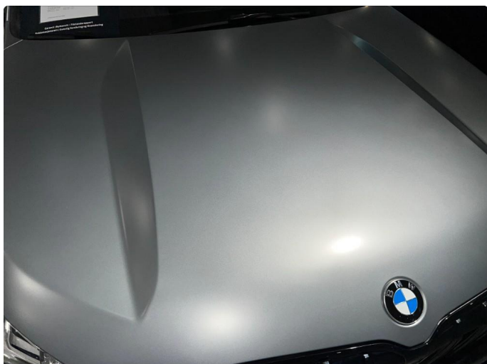
1.2 Noe mindre stensprut, bedre enn normalt for år/km.