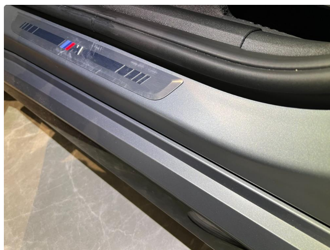
1.5 Riper/slitasje på terskel førerdør.