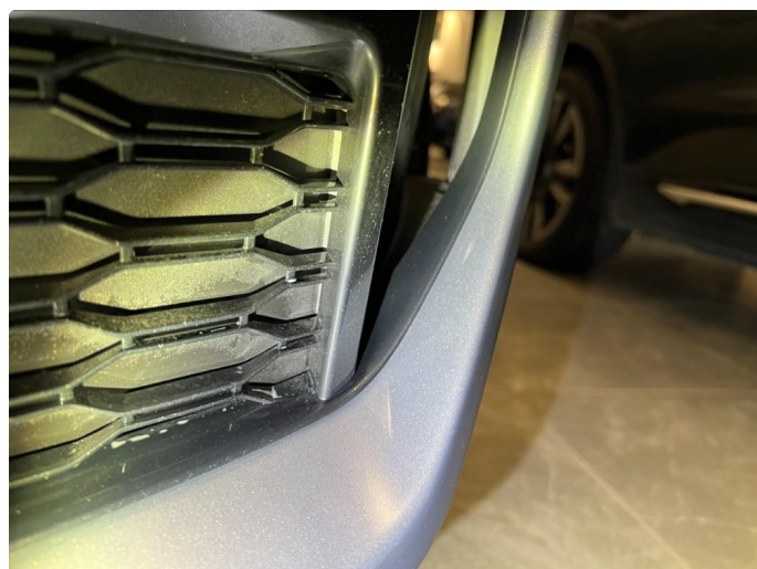
1.9 Sår/riper VSF. Normalt for år/km.