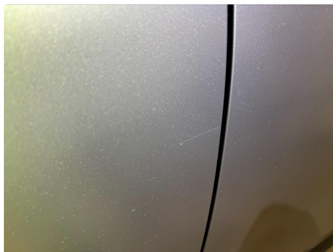
1.3 Sår/riper. Normalt for år/km.