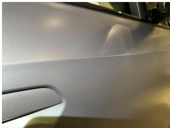
1.3 Sår/riper. Normalt for år/km.