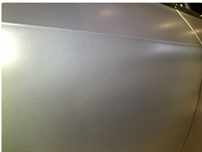
1.3 Sår/riper. Normalt for år/km.