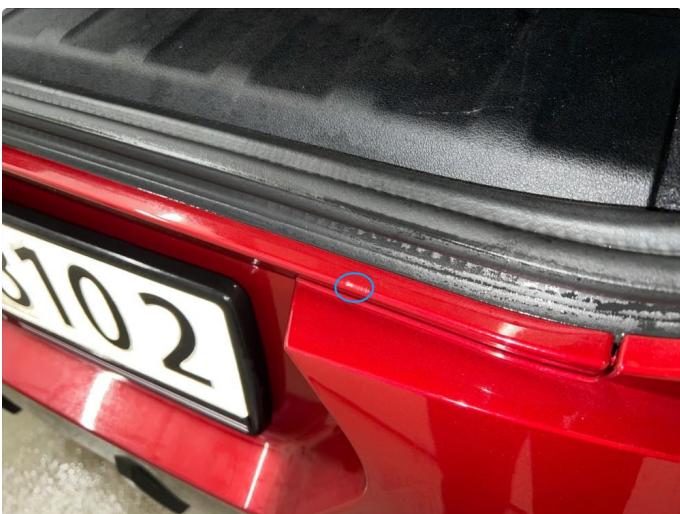
1.3 Riper/hakk ved innlastningssone bagasjerom.