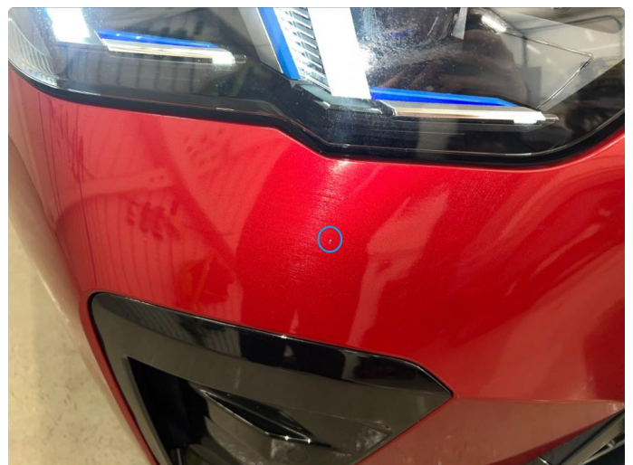
1.4 Sår/riper på front fanger, normalt for år/km.