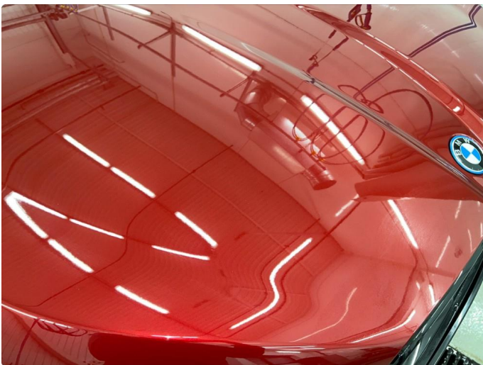
1.2 Sår/riper rundt om på panser, normalt for år/km.