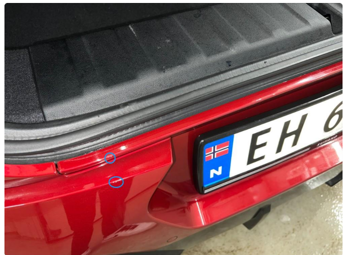
1.3 Riper/hakk ved innlastningssone bagasjerom.