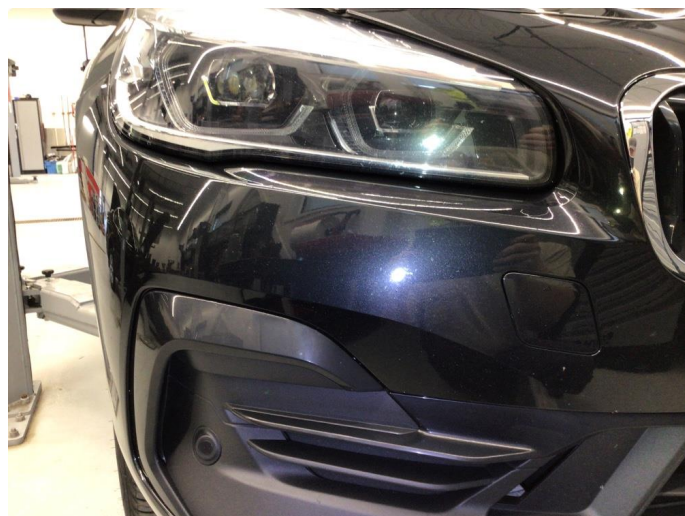
1.4 Noe steinsprut. Normal bruksslitasje mtp. alder.