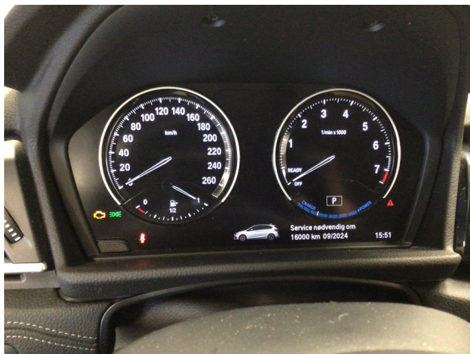
2.1 Bilen varsler service om 16000km 09/24.