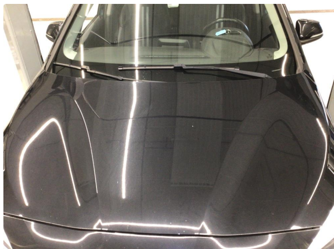
1.1 Noe steinsprut. Normal bruksslitasje mtp. alder.