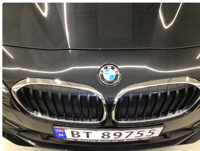
1.4 Noe steinsprut. Normal bruksslitasje mtp. alder.