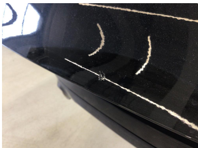
1.2 Hakk i lakken, bobledannelse rundt.