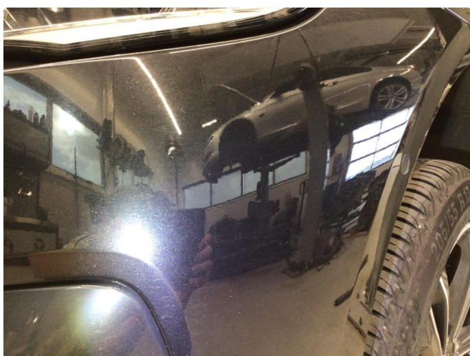
1.4 Noe steinsprut. Normal bruksslitasje mtp. alder.