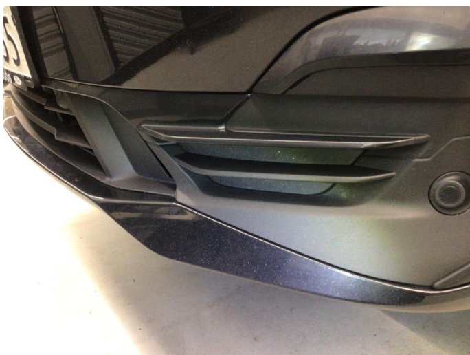
1.4 Noe steinsprut. Normal bruksslitasje mtp. alder.