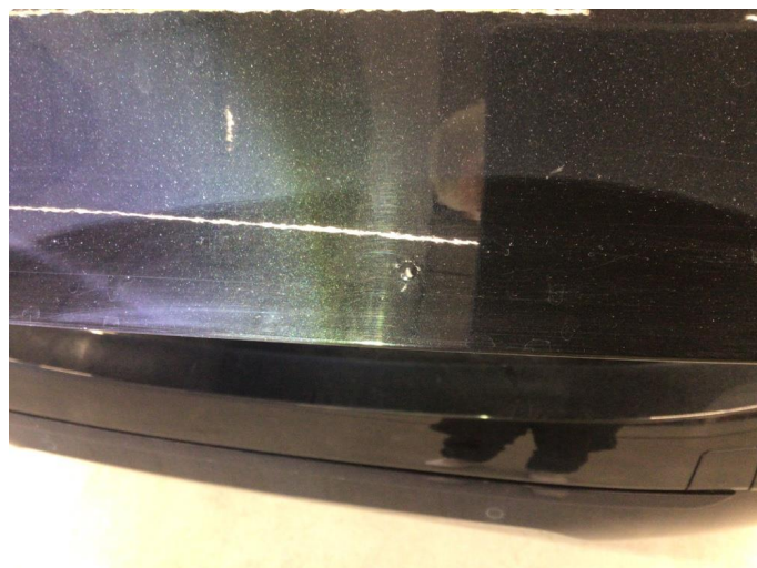
1.2 Hakk i lakken, bobledannelse rundt.