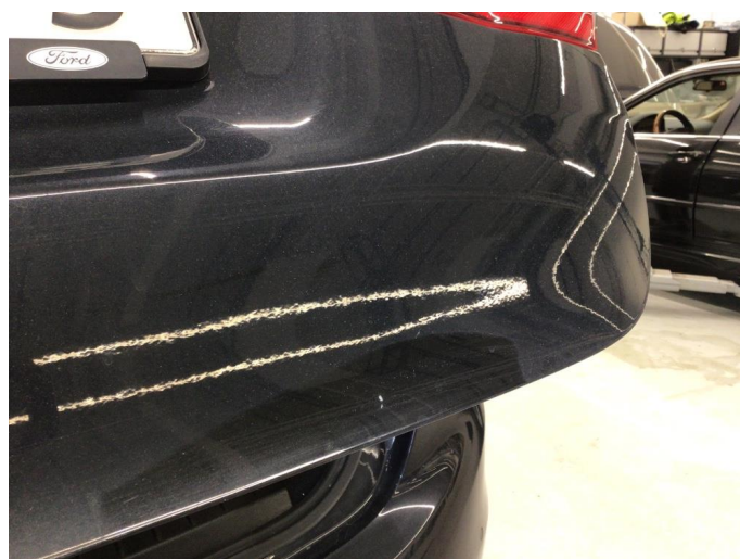
1.2 Hakk i lakken, bobledannelse rundt.