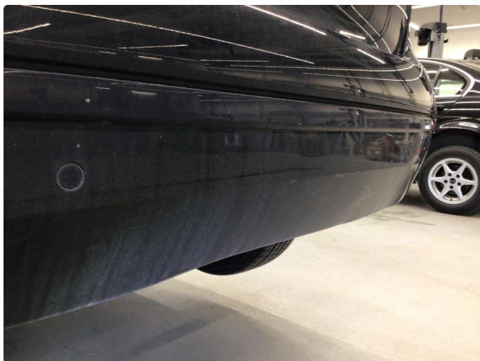
1.6 Noe små hakk og riper