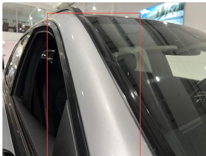
1.10 Riper langs stolpe