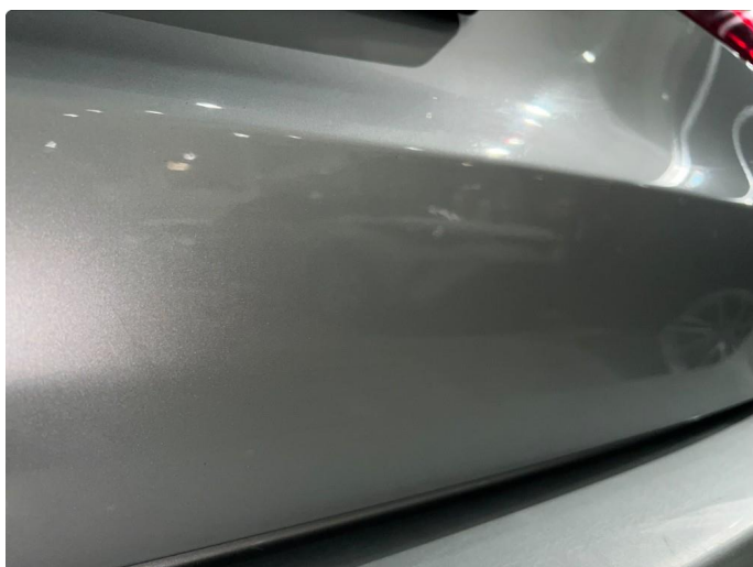
1.3 Ripper/sten sprut på bakluke. Normalt for år/km