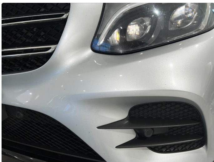
1.7 Steinsprut foran, begge sider. Normalt for år/km