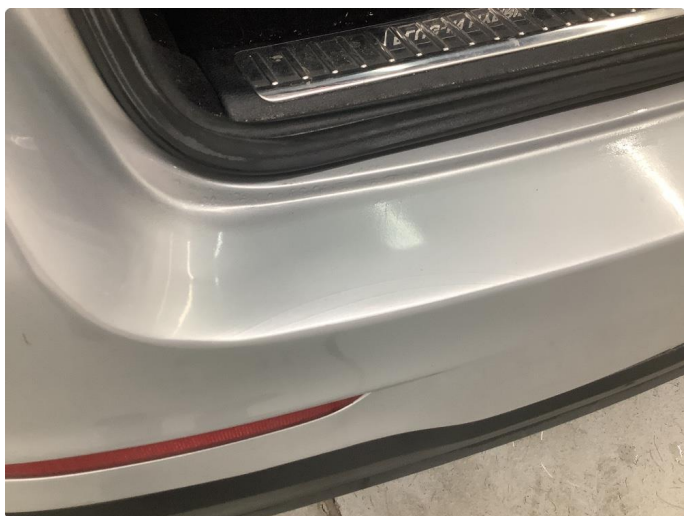
1.6 Små sprekker etter parkeringsskade. Vanskelig å få frem på bilder