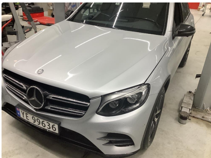
1.1 Sår/riper rundt om på bil. Normalt med år/km