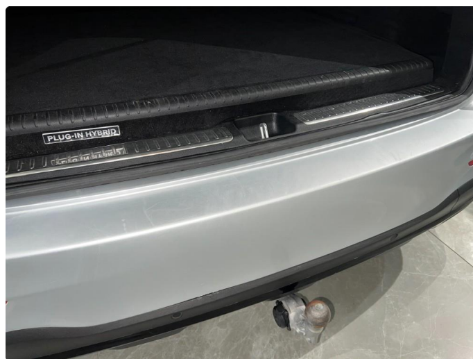
1.8 Sår/riper på fanger bak. Normalt for år/km