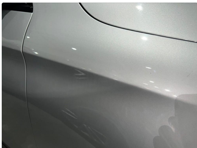
1.4 Sår/sten sprang foran. Normalt for år/km