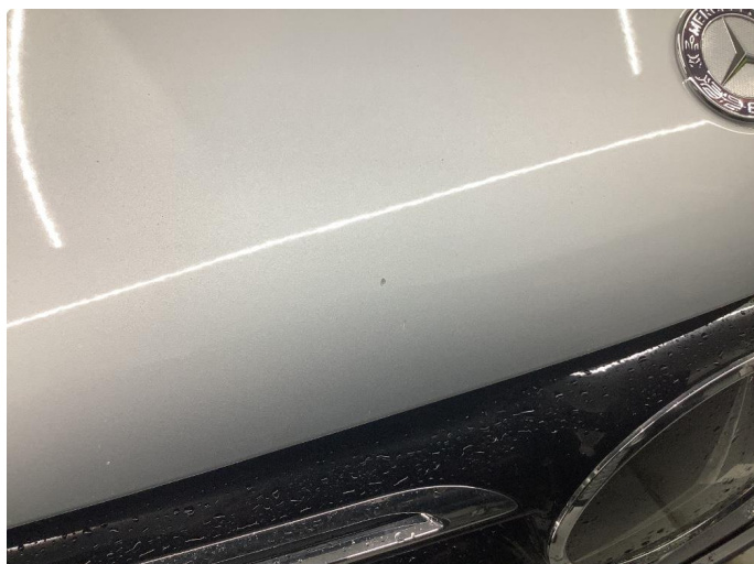
1.2 Steinsprang på panser, normalt for år/km