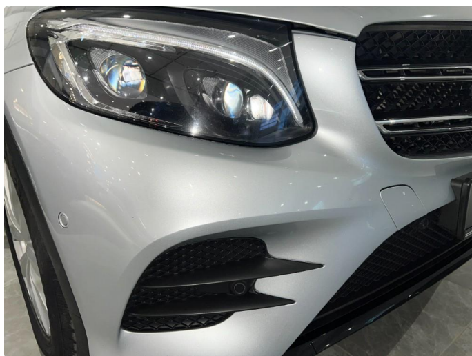
1.7 Steinsprut foran, begge sider. Normalt for år/km