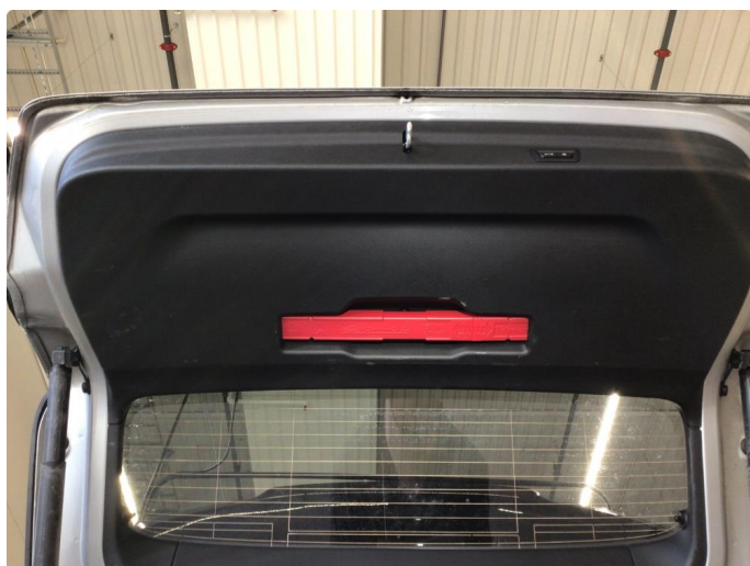
2.2 Bakluketrekk ripe(r)