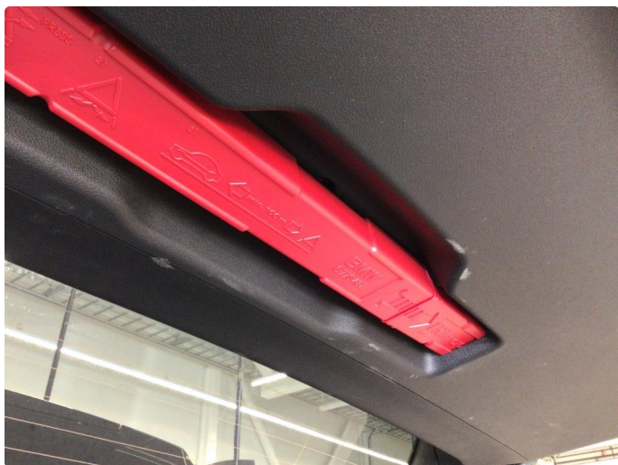
2.2 Bakluketrekk ripe(r)