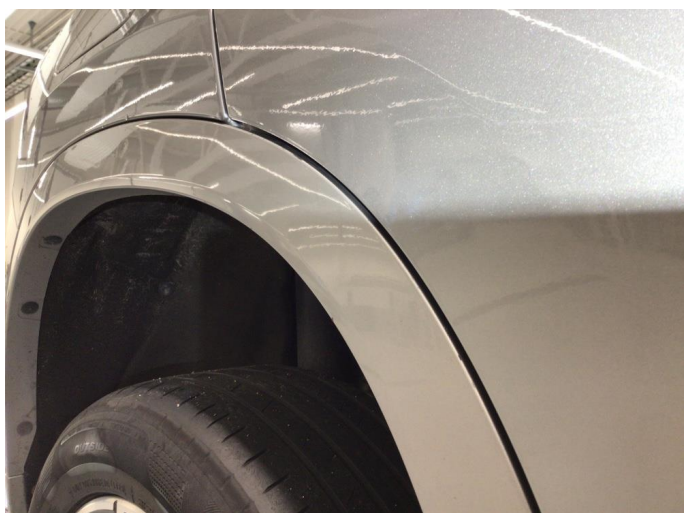
1.2 Skjermutbygger skadet