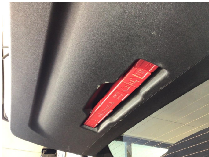
2.2 Bakluketrekk ripe(r)