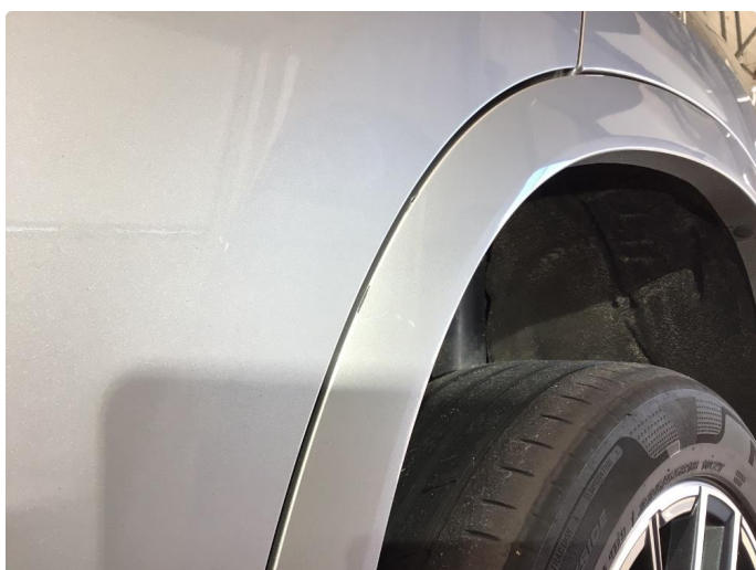
1.2 Skjermutbygger skadet