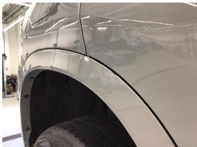
1.2 Skjermutbygger skadet