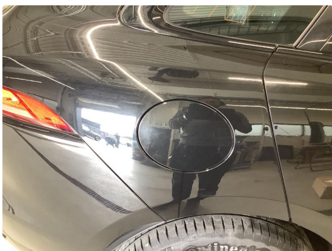
1.1 Generelt mye bruksslitasje