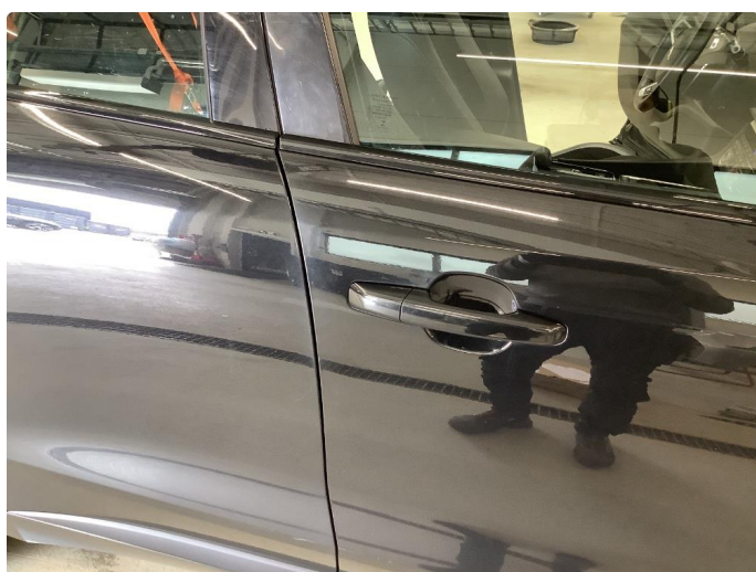
1.1 Generelt mye bruksslitasje