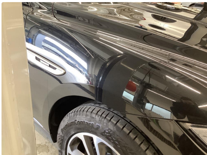
1.1 Generelt mye bruksslitasje