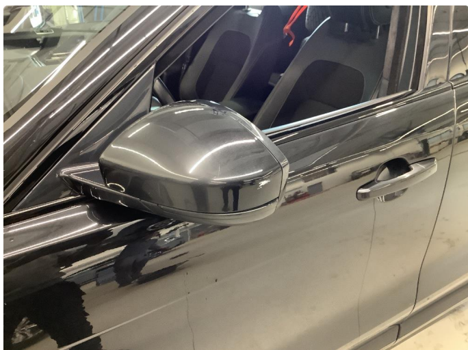
1.1 Generelt mye bruksslitasje