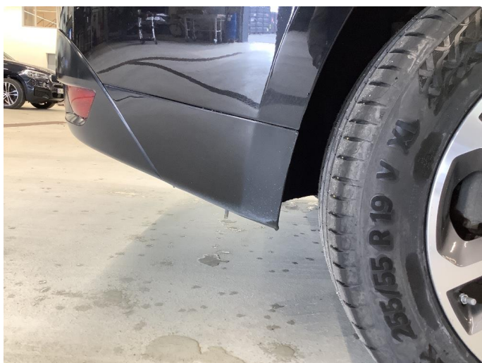
1.3 Matt/slitt lakk