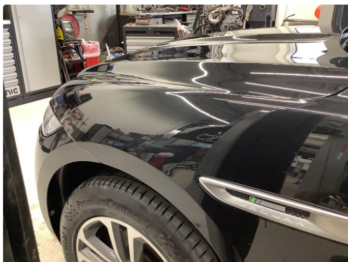
1.1 Generelt mye bruksslitasje