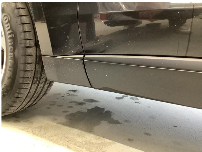
1.3 Matt/slitt lakk