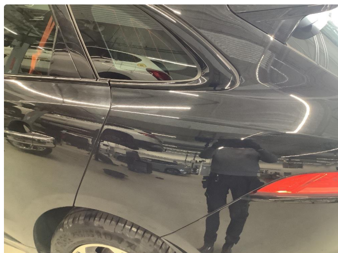
1.1 Generelt mye bruksslitasje