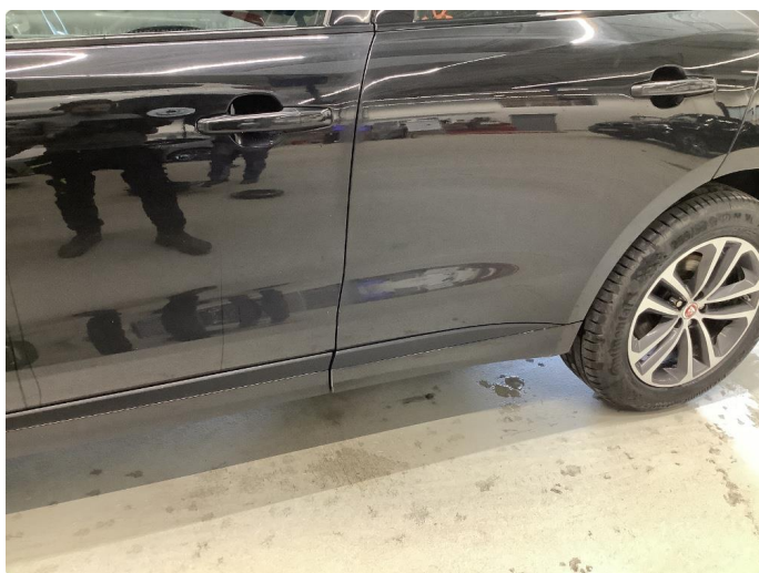
1.2 Generelt mye stensprut