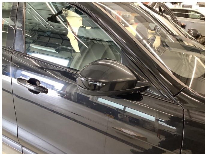
1.1 Generelt mye bruksslitasje