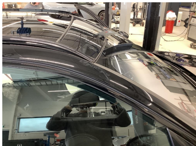
1.1 Generelt mye bruksslitasje