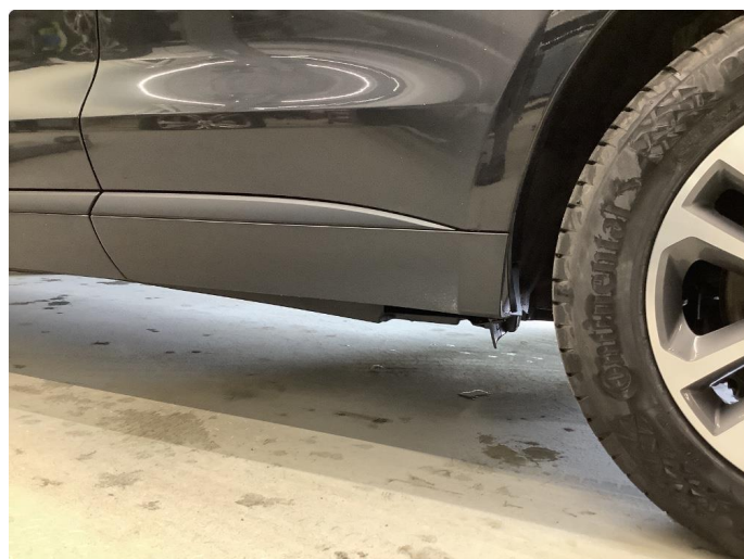
1.3 Matt/slitt lakk