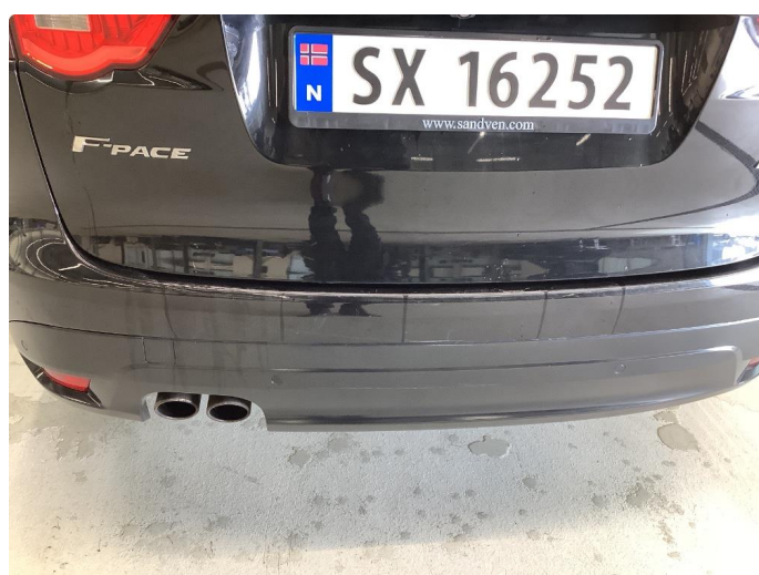
1.1 Generelt mye bruksslitasje