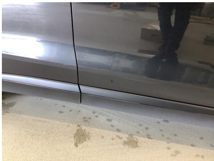
1.1 Generelt mye bruksslitasje