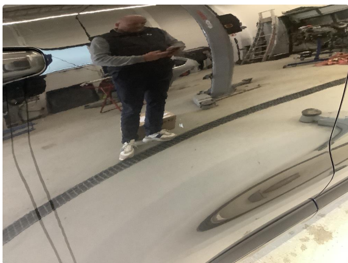
1.1 Generelt mye bruksslitasje