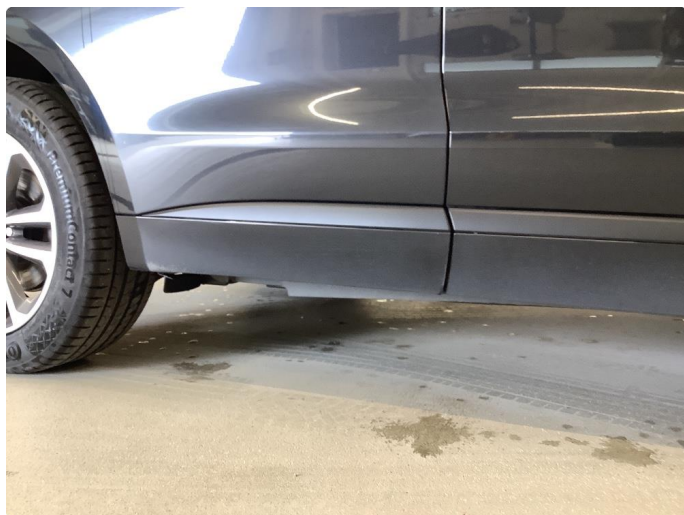
1.3 Matt/slitt lakk