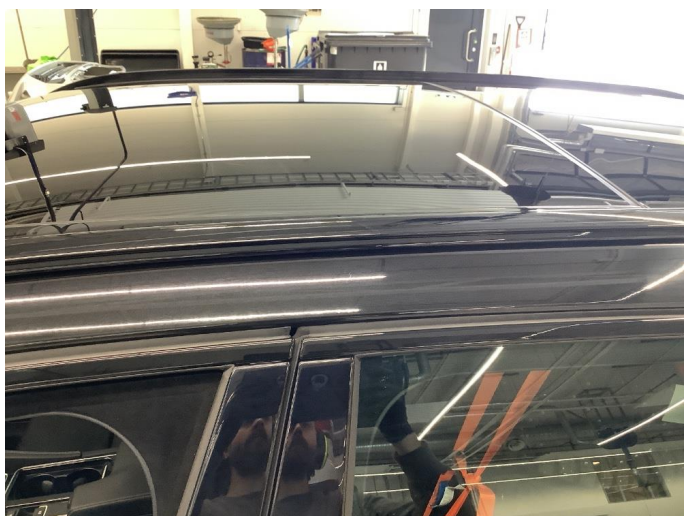
1.1 Generelt mye bruksslitasje