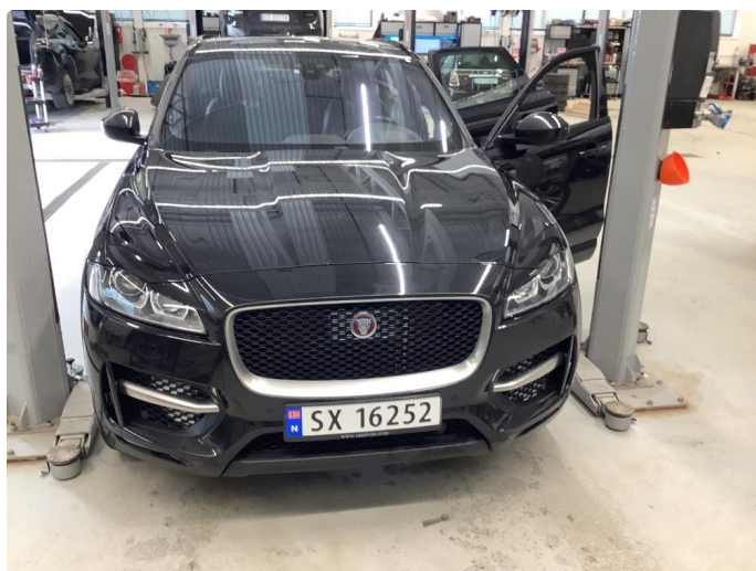
1.1 Generelt mye bruksslitasje