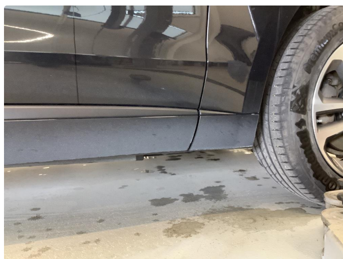
1.3 Matt/slitt lakk