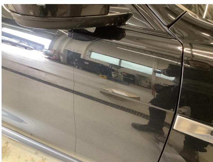
1.1 Generelt mye bruksslitasje