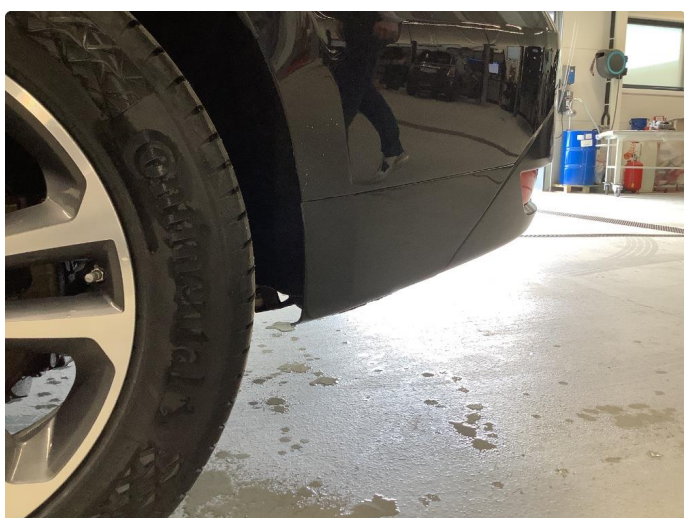
1.3 Matt/slitt lakk