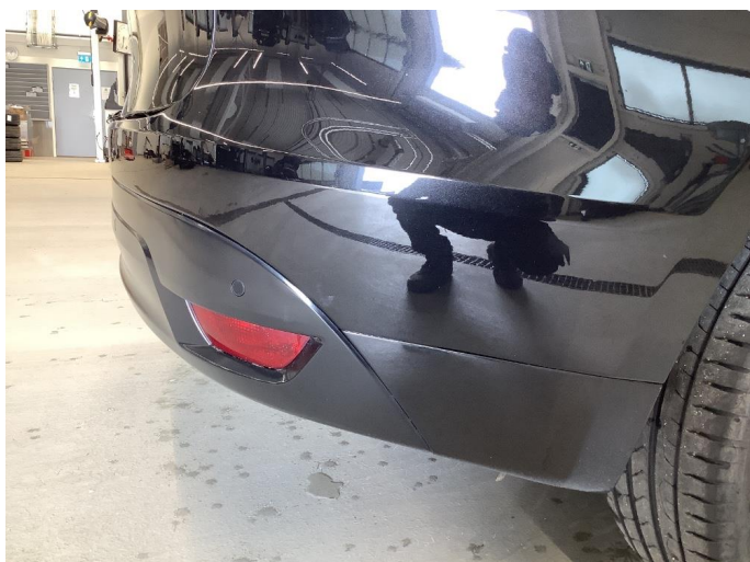
1.1 Generelt mye bruksslitasje