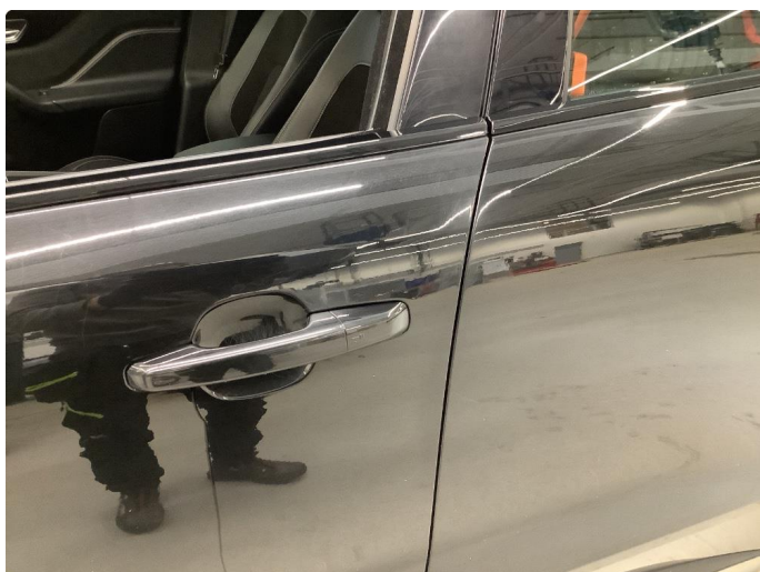
1.1 Generelt mye bruksslitasje