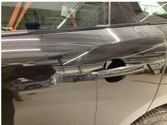
1.1 Generelt mye bruksslitasje