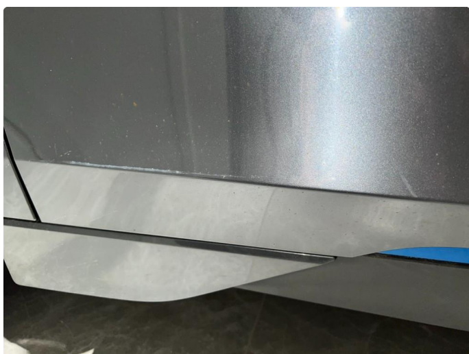
1.1 Sår/riper rundt om på bilen. Normalt med tanke på år/km.