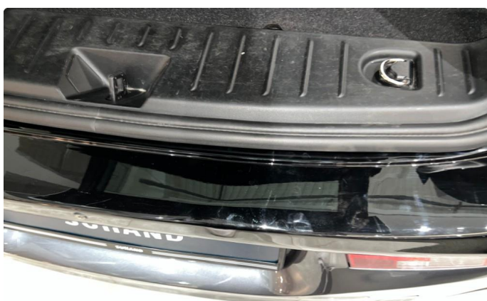
1.1 Sår/riper rundt om på bilen. Normalt med tanke på år/km.