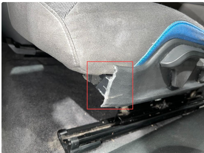
2.2 Deksel under fører sete knekt på enden.