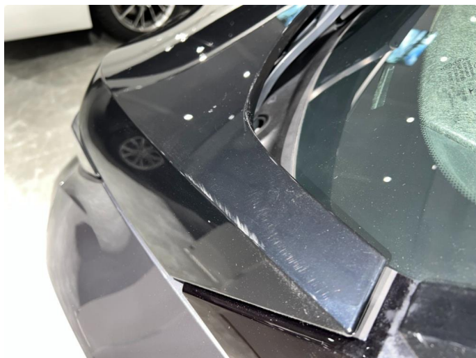
1.1 Sår/riper rundt om på bilen. Normalt med tanke på år/km.