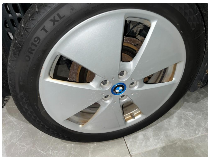
1.2 Sår/riper på vinterfelger.