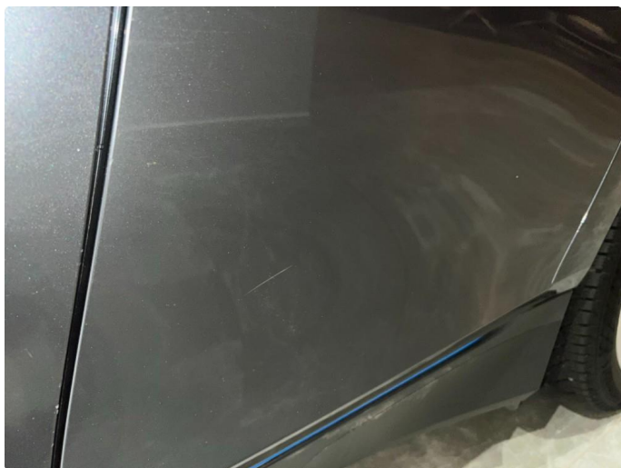
1.1 Sår/riper rundt om på bilen. Normalt med tanke på år/km.