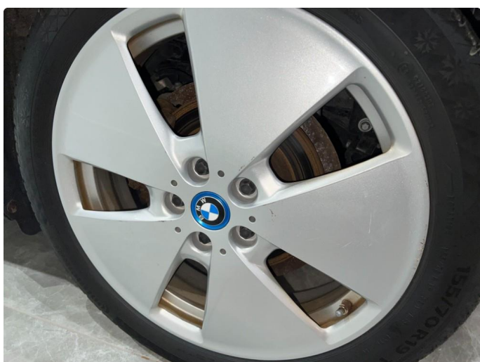
1.2 Sår/riper på vinterfelger.