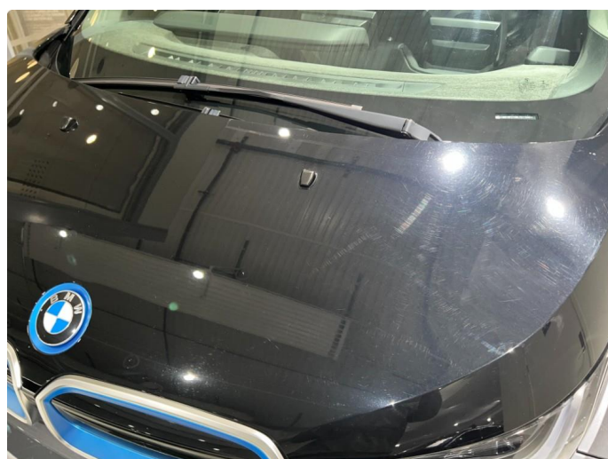
1.1 Sår/riper rundt om på bilen. Normalt med tanke på år/km.