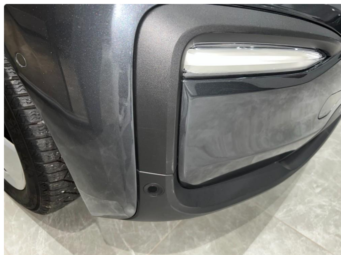
1.1 Sår/riper rundt om på bilen. Normalt med tanke på år/km.