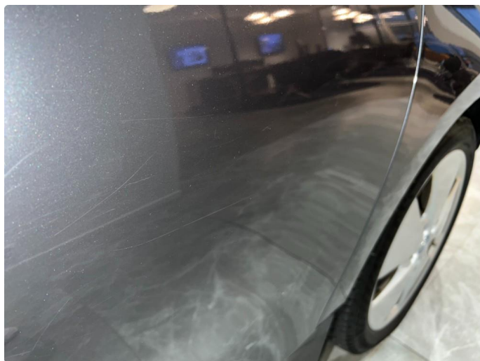
1.1 Sår/riper rundt om på bilen. Normalt med tanke på år/km.