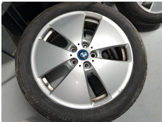
1.3 Sår/riper på sommerfelger.