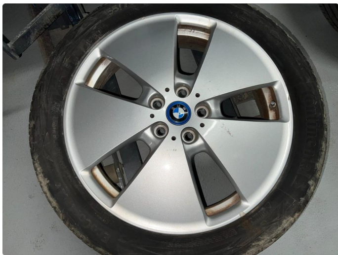
1.3 Sår/riper på sommerfelger.