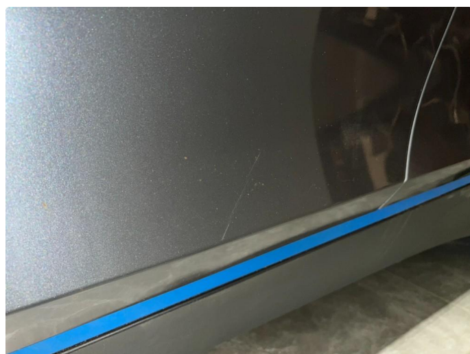
1.1 Sår/riper rundt om på bilen. Normalt med tanke på år/km.