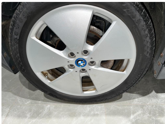
1.2 Sår/riper på vinterfelger.