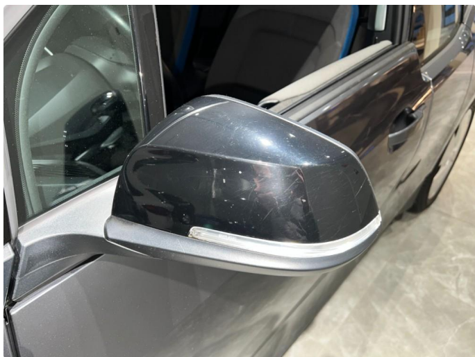
1.1 Sår/riper rundt om på bilen. Normalt med tanke på år/km.