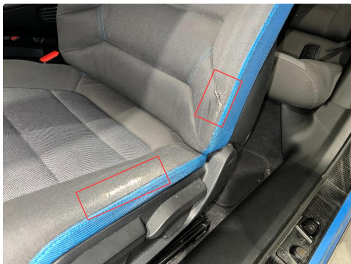
2.1 Slitasje/rift på fører sete.