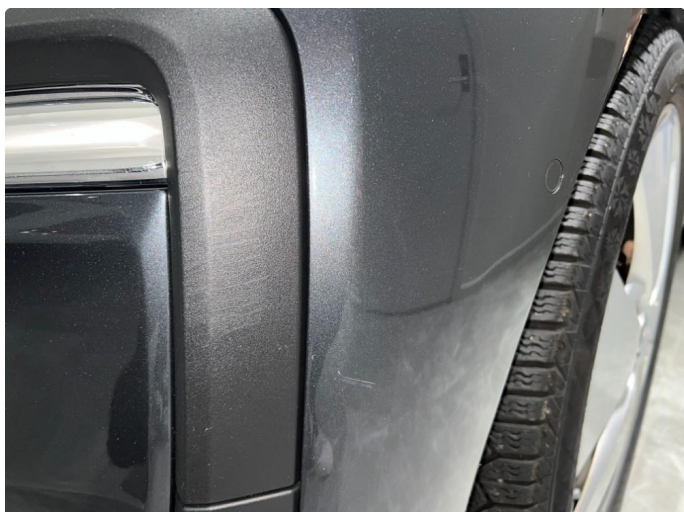
1.1 Sår/riper rundt om på bilen. Normalt med tanke på år/km.