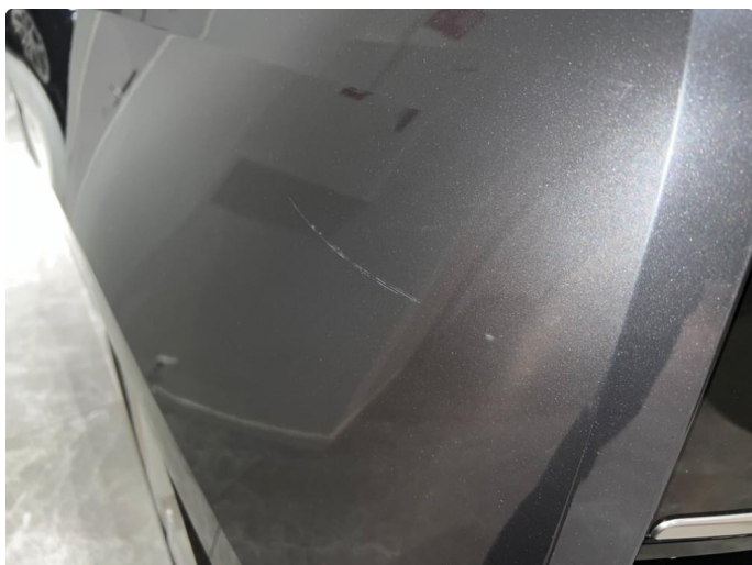
1.1 Sår/riper rundt om på bilen. Normalt med tanke på år/km.