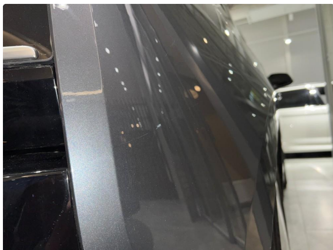
1.1 Sår/riper rundt om på bilen. Normalt med tanke på år/km.