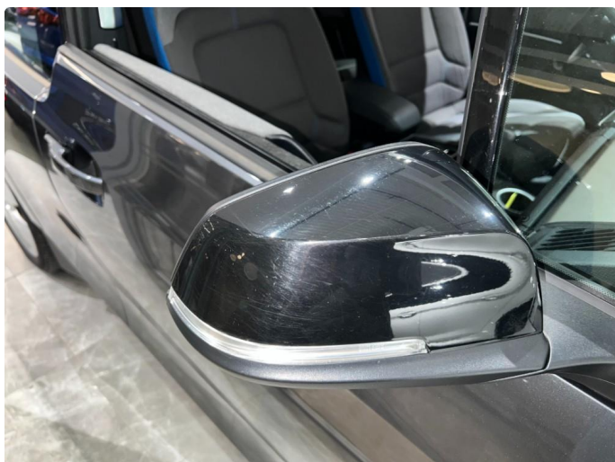
1.1 Sår/riper rundt om på bilen. Normalt med tanke på år/km.