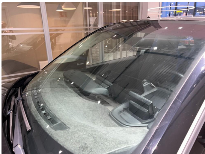
1.4 Slitasje på front rute, normalt for år/km.