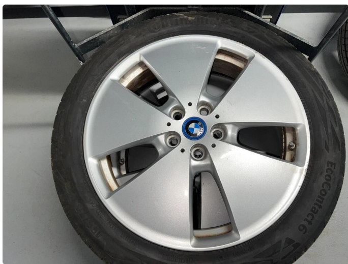
1.3 Sår/riper på sommerfelger.