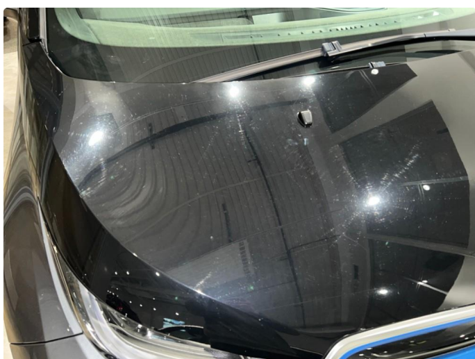
1.1 Sår/riper rundt om på bilen. Normalt med tanke på år/km.