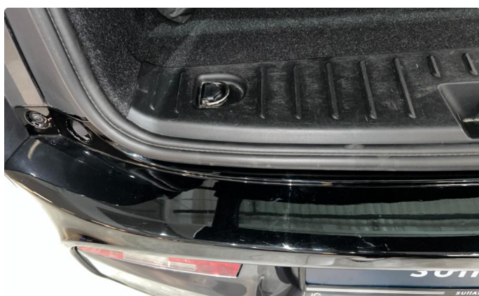
1.1 Sår/riper rundt om på bilen. Normalt med tanke på år/km.