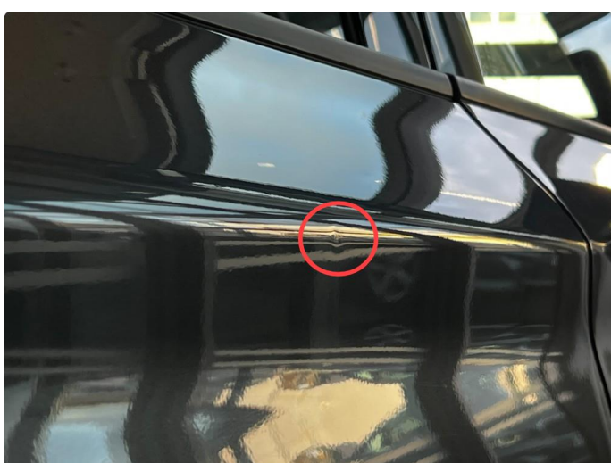
1.3 Parkerings bulk hsb