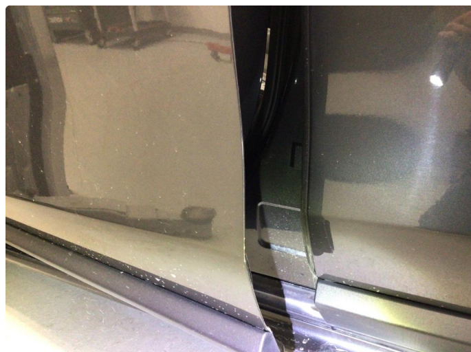
1.2 Riper på dørkant