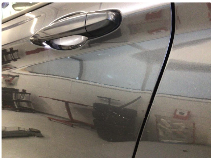
1.2 Riper på dørkant