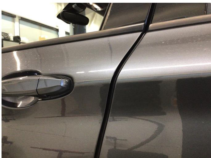
1.2 Riper på dørkant