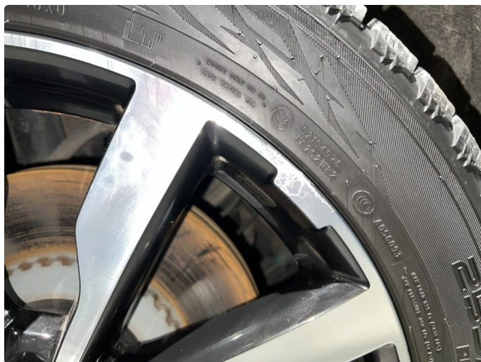
1.8 Skade/sår vinterfelger.