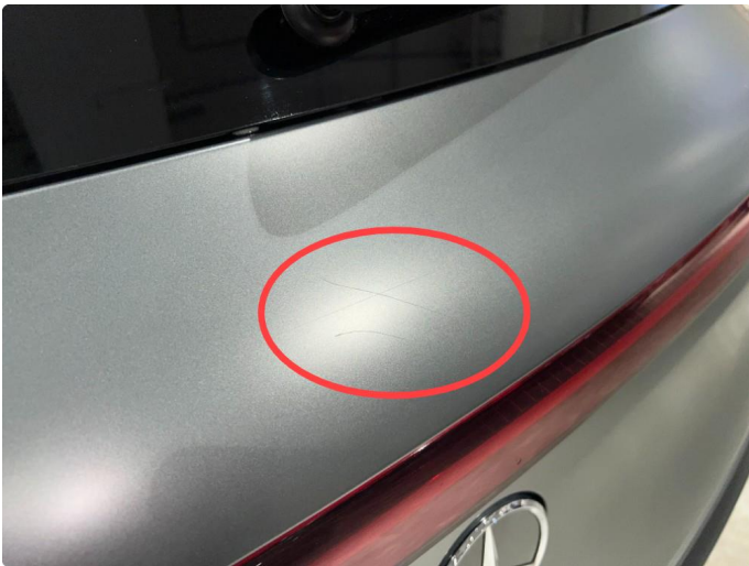
1.5 Mindre sår/riper på bakluke.