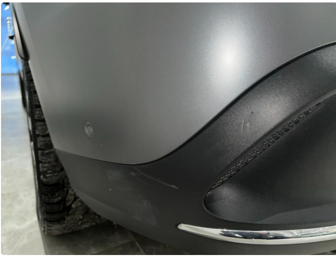
1.10 Sår/riper på bak fanger, normalt for år/km.