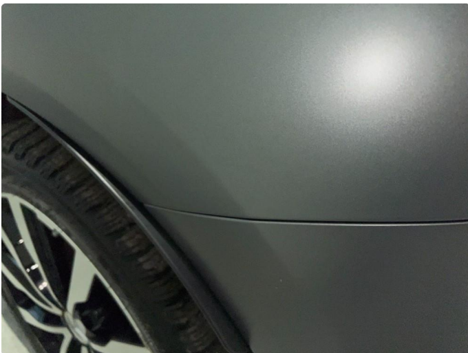
1.6 Sår/riper. Normalt for år/km.