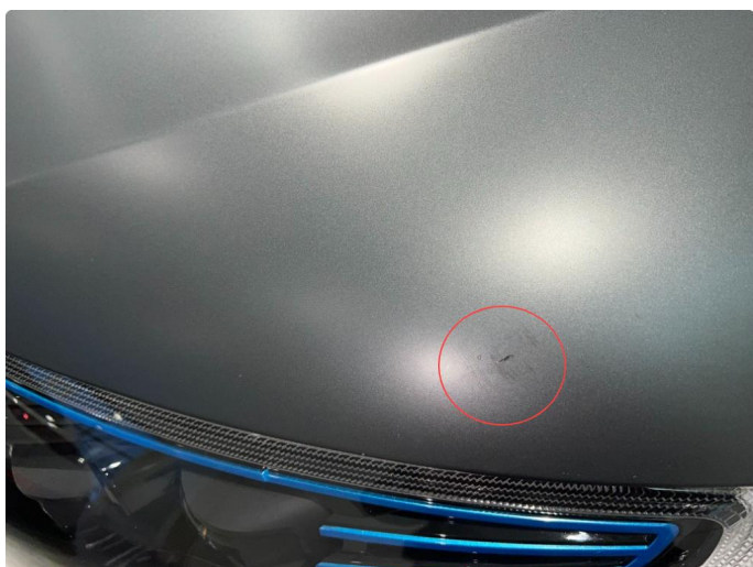
1.2 Stensprut rundt om på panser. Normalt for år/km.