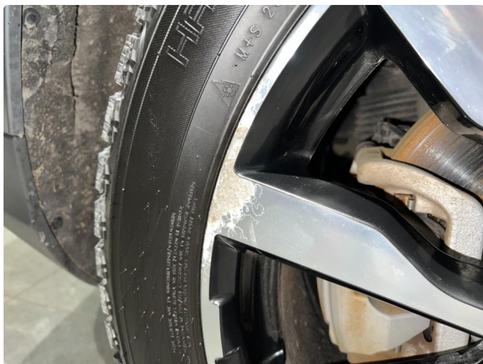
1.8 Skade/sår vinterfelger.