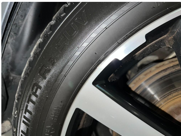
1.8 Skade/sår vinterfelger.