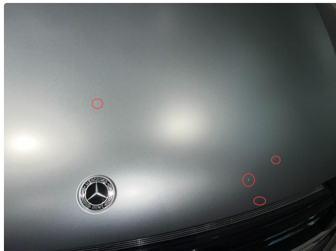
1.2 Stensprut rundt om på panser. Normalt for år/km.