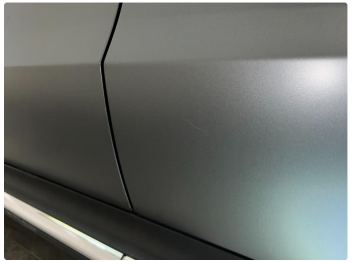
1.4 Sår/riper rundt om på dører.