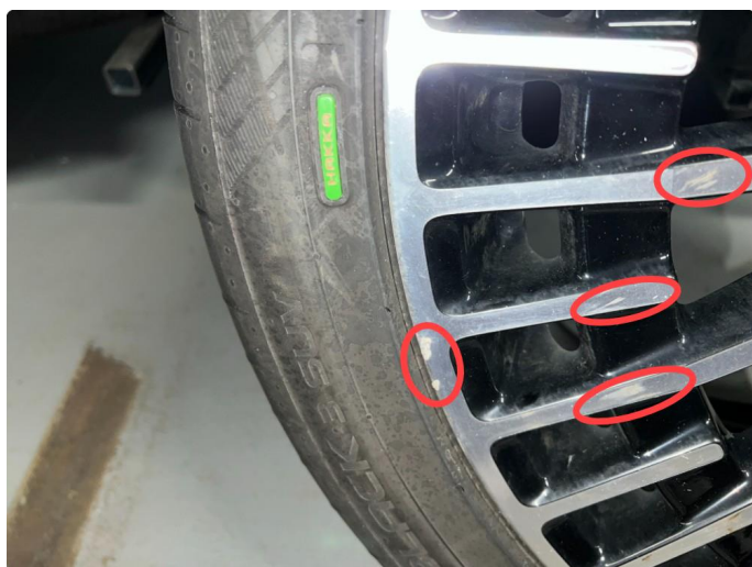
1.7 Sommerfelg hsf kantkjørt.