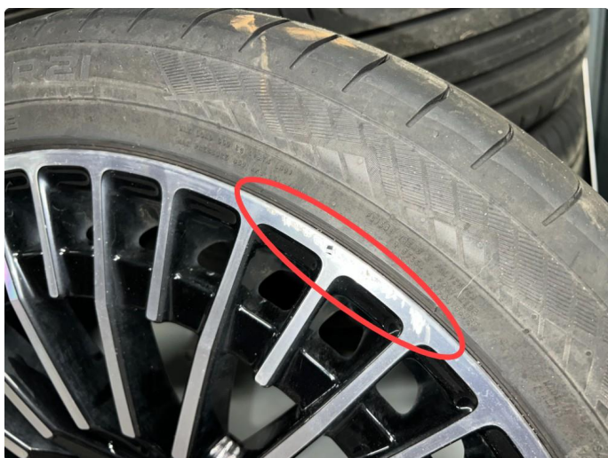
1.7 Sommerfelg hsf kantkjørt.