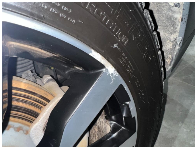
1.8 Skade/sår vinterfelger.