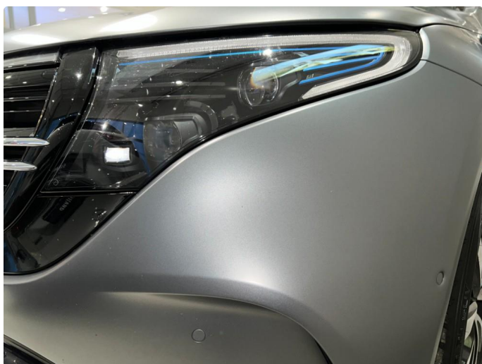
1.9 Mindre stensprut på front fanger. Normalt for år/km.