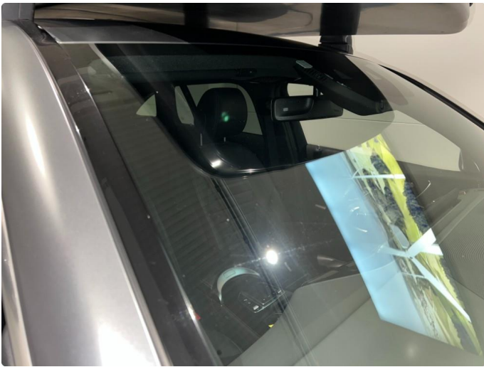
1.12 Mindre stensprut/slitasje. Normalt for år/km