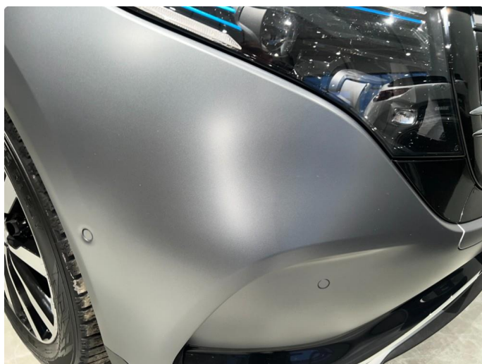
1.9 Mindre stensprut på front fanger. Normalt for år/km.