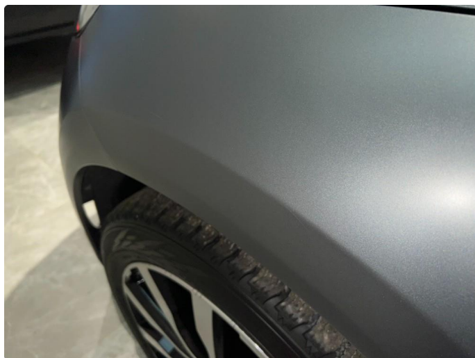
1.6 Sår/riper. Normalt for år/km.