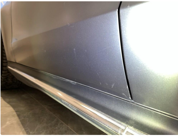
1.4 Sår/riper rundt om på dører.