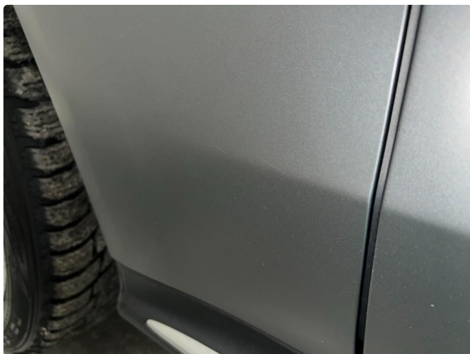
1.6 Sår/riper. Normalt for år/km.