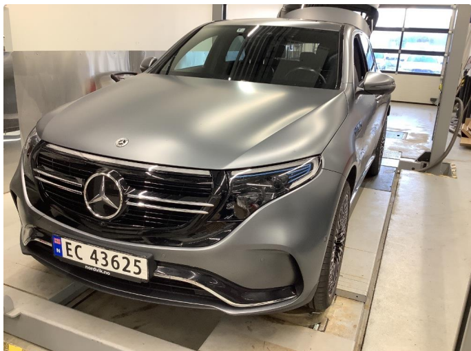
1.1 Sår/riper rundt om på bilen. Normalt med tanke på år/km.