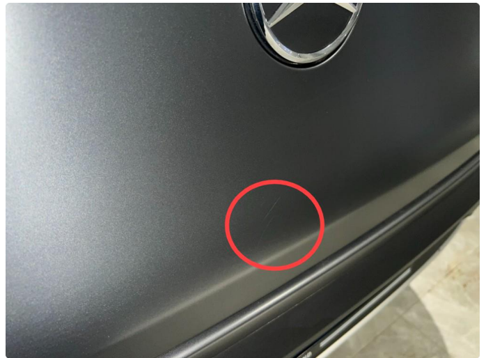
1.5 Mindre sår/riper på bakluke.