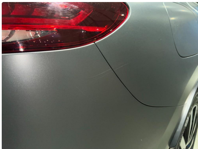
1.10 Sår/riper på bak fanger, normalt for år/km.