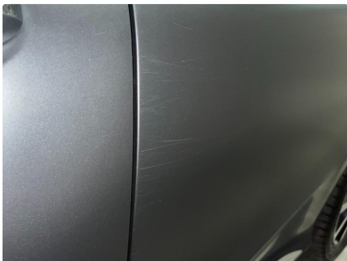
1.4 Sår/riper rundt om på dører.