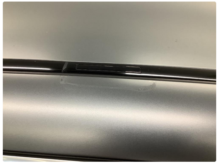
1.11 Riper etter montering av takboks, alle sider.