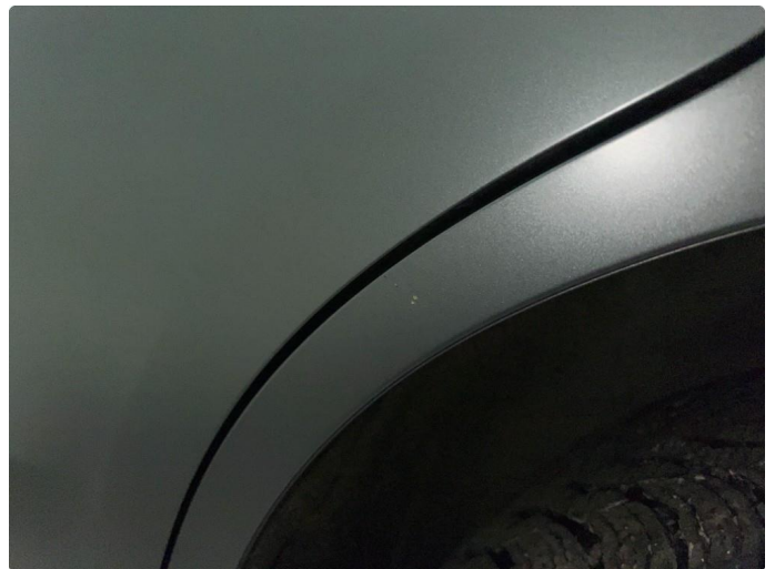
1.6 Sår/riper. Normalt for år/km.