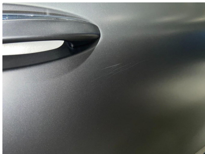
1.4 Sår/riper rundt om på dører.